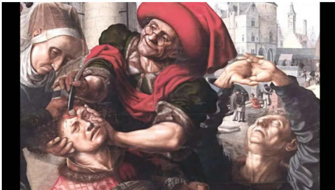
Босх. Извлечение камня глупости

Конечно, рисуя в уме такой образ, добровольно к психологу не пойдешь.