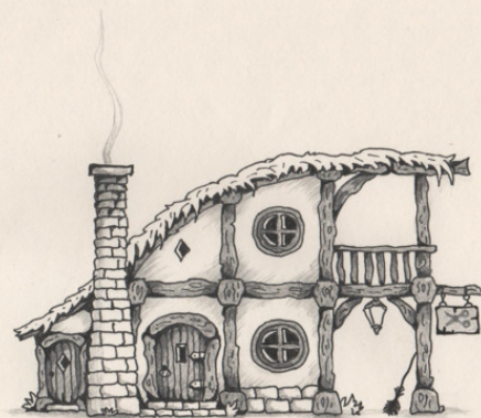
ДОМ МАЛЮТКИ ЛАДА