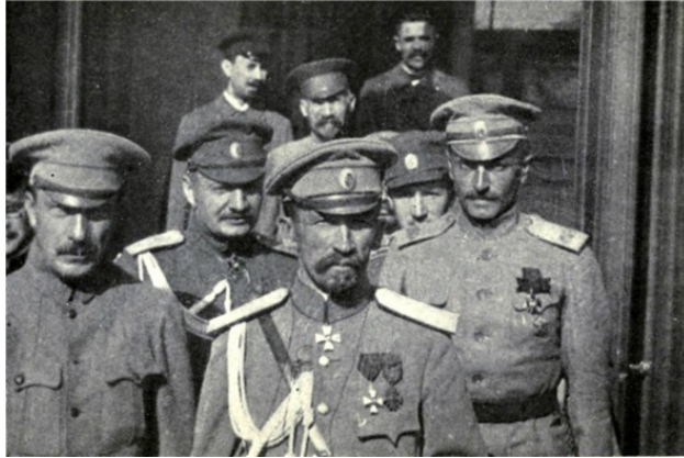
Корнилов с офицерами

8 июля А.Ф.Керенский стал главой правительства. 18 июля он снял с поста Главнокомандующего А. М. Брусилова, назначив на его место генерала Л. Г. Корнилова. А 19 августа немцы прорвали Северный фронт. Корнилов приказал оставить Ригу.