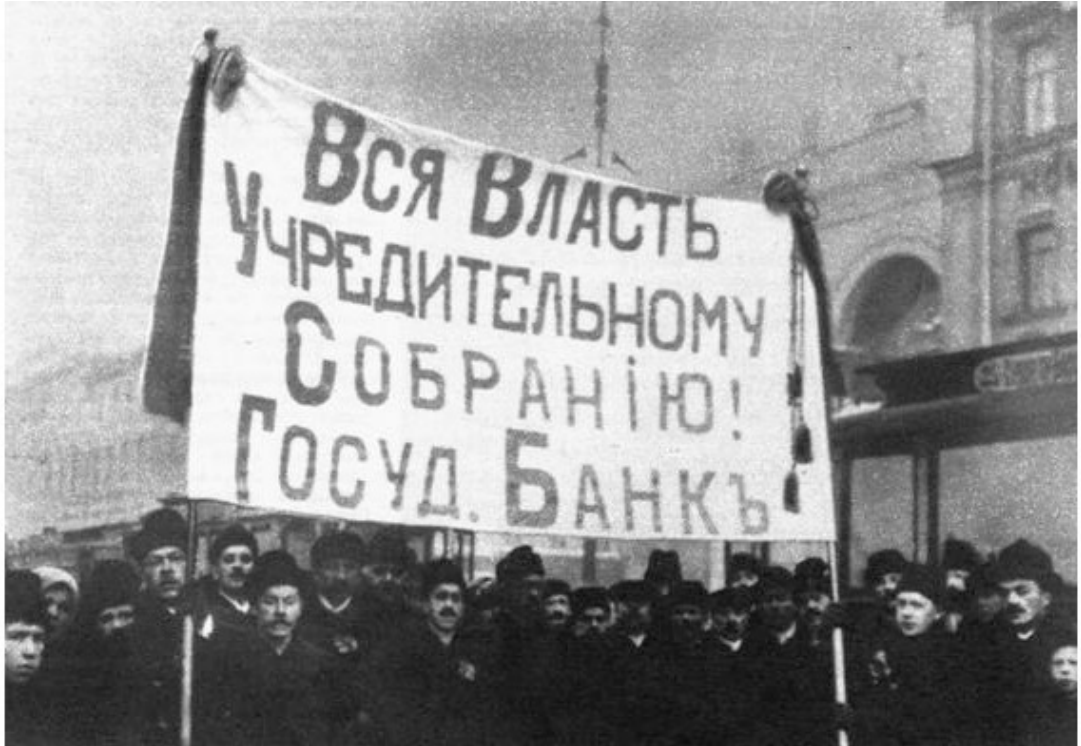
Демонстрация в поддержку Учредительного собрания.

1918. 4 января ВЦИК провозгласил Российскую Советскую Республику.