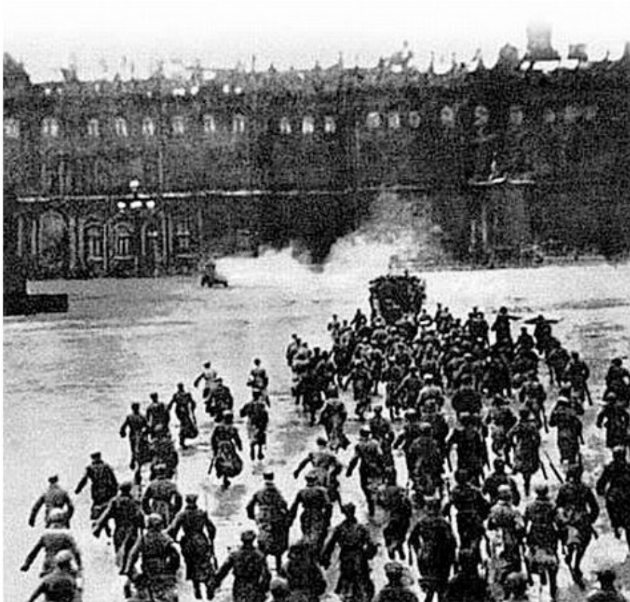
Штурм Зимнего (реконструкция)

Меньшевики, правые эсеры и бундовцы резко осудили революционные действия большевиков и потребовали начать переговоры с временным правительством. Не получив одобрения Съезда, они покинули заседание.