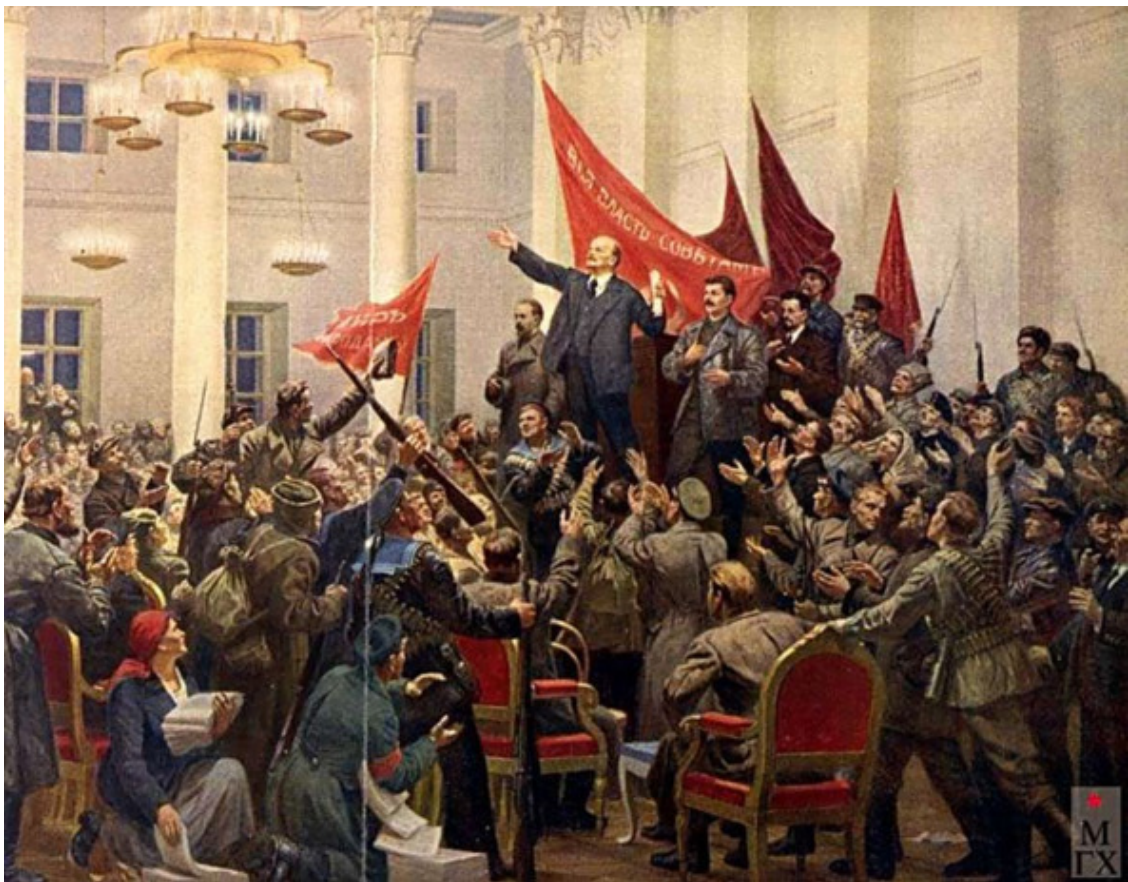
Второй Всероссийский съезд рабочих и солдатских депутатов

Съезд Советов учредил и сформировал временное рабочее и крестьянское правительство – Совет Народных Комиссаров во главе с В. И. Лениным.