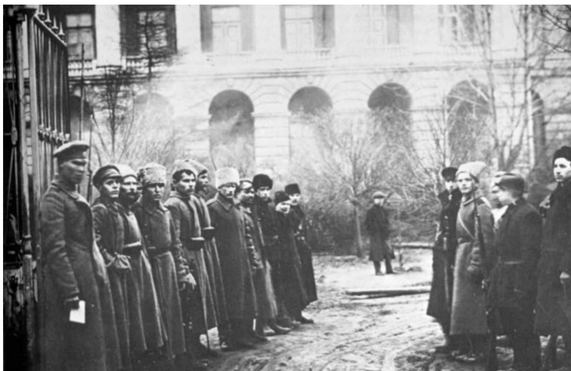
Красногвардейцы у Смольного

К 24 октября этот состав был усилен ротой 1-го Петроградского женского батальона, юнкерами, казаками и насчитывал уже до 1600 человек. Ждали прибытия войск с фронта для атаки Смольного института, где размещался ЦК РКП (б), Петросовет и ВРК.