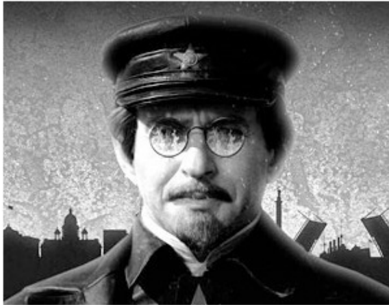
Лев Давыдович Троцкий

В начале августа закончил работу VI съезд Российской коммунистической партии большевиков – РКП (б) (так после съезда стала называться РСДРП (б), который принял решение о переходе с мирных средств борьбы на вооруженный захват власти.