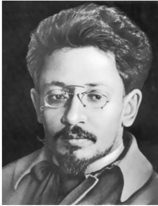
Яков Михайлович Свердлов