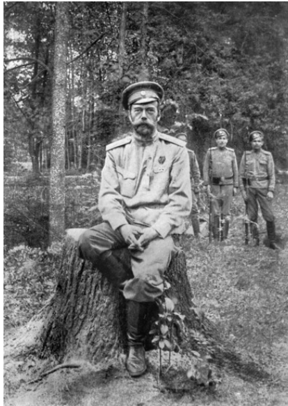
Николай пода арестом. Гатчина

Отрекшись от престола, Николай II изъявил желание поселиться в Ливадии и заняться уходом за садом. Однако временное правительство решило арестовать его, что и было сделано 8 марта. Сначала его поместили в Гатчине, а 1 августа Николай с семьёй был выслан в Тобольск.