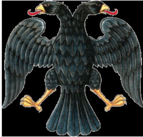
Герб Российско республики

7 апреля был опубликован рисунок герба новой России. Он имел вид двуглавого орла времен Ивана III без какой-либо атрибутики. В качестве флага был использован царский триколор (белый, синий, красный)