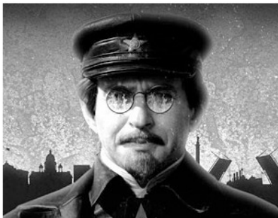
Лев Давыдович Троцкий

В начале августа закончил работу VI съезд Российской коммунистической партии большевиков – РКП (б) (так после съезда стала называться РСДРП (б), который принял решение о переходе с мирных средств борьбы на вооруженный захват власти.