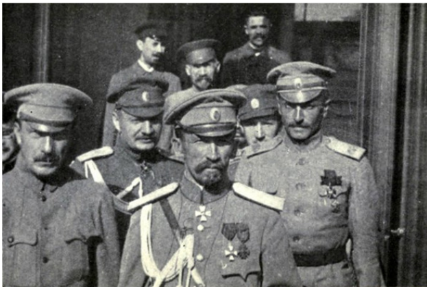
Корнилов с офицерами

8 июля А.Ф.Керенский стал главой правительства. 18 июля он снял с поста Главнокомандующего А. М. Брусилова, назначив на его место генерала Л. Г. Корнилова. А 19 августа немцы прорвали Северный фронт. Корнилов приказал оставить Ригу.