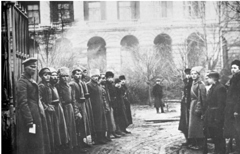
Красногвардейцы у Смольного