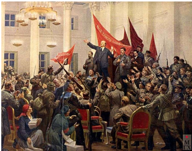
Второй Всероссийский съезд рабочих и солдатских депутатов