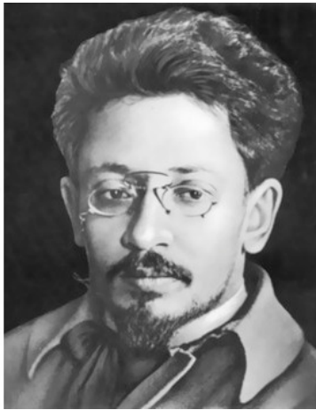
Яков Михайлович Свердлов