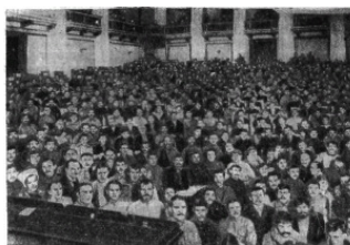
Заседание III Всероссийского съезда Советов 10—18 января 1918 г. Петроград.

17 января, когда вновь открылась мирная конференция, в Брест-Литовск прибыли представители победившей Советской власти на Украине. Они и выступили со своей декларацией. Украинская Центральная рада к этому времени уже перестала существовать. Территория ее свелась только к той комнате, которую она занимала в Брест-Литовске. Представителям Украинской Центральной рады после перерыва еле-еле удалось вернуться на конференцию. Как выяснилось позже, дипломаты Рады пробрались в Брест-Литовск обманным путем: они заявили красногвардейцам, что составляют часть советской делегации. В ответ представитель Австро-Венгрии, министр иностранных дел, граф О. Чернин заявил, что 12 января на пленарном заседании Германия и Австро-Венгрия при знали делегацию Украинской