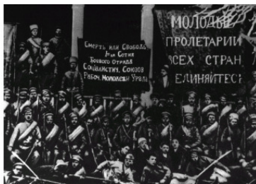
Рабочая молодежь Урала, 1918 г.

В 7 часов утра Ленин сообщил в Берлин, Вену, Софию и Константинополь о принятии ультиматума и отправке делегации в Брест-Литовск. Делегация в составе: Г. Я. Сокольников (председатель), Г. И. Петровский, Г. В. Чичерин, Л. М. Карахан и др., выехала туда в тот же день. Между тем лидеры «левых коммунистов» не подчинились решению ЦК, не сложили оружия. Имея большинство в Московском областном бюро, они попытались превратить московскую партийную организацию в свою опору в борьбе против Центрального Комитета. Узкий состав Московского областного бюро РСДРП (б), куда входили Ломов, Манцев, Сапронов, Оболенский (Осинский), Яковлева, принял постановление о недоверии ЦК «ввиду его политической линии и состава». «Мы считаем целесообразным идти на возможность утраты Советской власти, становящейся теперь чисто формальной». Однако немцы продолжали своё наступление на Белоруссию и на Украину.