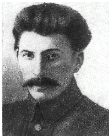
Руководители большевиков: И. В. Сталин (Джугашвили)