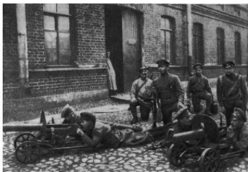
Обучение красноармейцев пулеметной стрельбе. Петроград. Март 1918 г. Фотография.

Здесь советская делегация заявила, что заключение мира «совершается в небывалых условиях, в неслыханной атмосфере насилия». Германские войска продолжают наступать; на обсуждение договора даётся только три дня. В связи с этим советская делегация отказывается обсуждать условия мира и принимает их в той форме, в какой они предлагаются. Розенберг в ответ на это цинично заявил: «Между тем условия да и наши требования изменились. Требования увеличились; но и теперь они ещё далеки от того, чтобы их можно было рассматривать как бесцеремонную эксплуатацию соотношения сил».