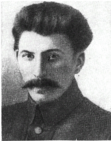
Руководители большевиков: И. В. Сталин (Джугашвили)