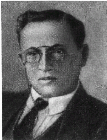
Руководители большевиков: М. С. Урицкий