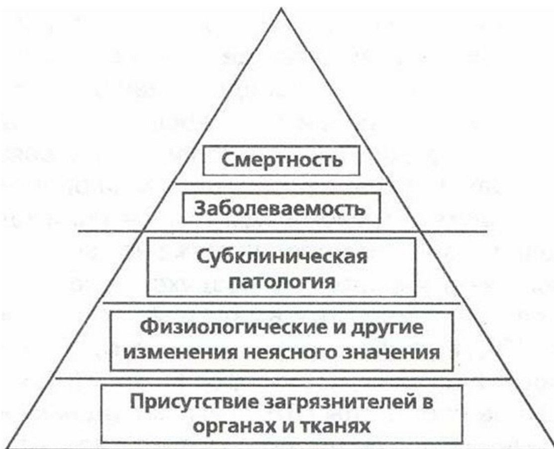
Рис. 2. Варианты последствий воздействия опасных и вредных факторов окружающей среды на здоровье человека

гих). Схематически спектр последствий негативных воздействий факторов окружающей среды можно представить в виде пирамиды, острие которой ориентировано на наиболее тяжелые варианты исходов – смерть или развитие клинически выраженной патологии (рис. 2).