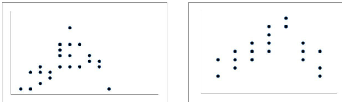
Рис. 1.1. Варианты диаграмм совместного рассеивания точек (каждая точка – испытуемый) в двумерном исследовании

Количественным выражением такого вида связи является коэффициент корреляции.