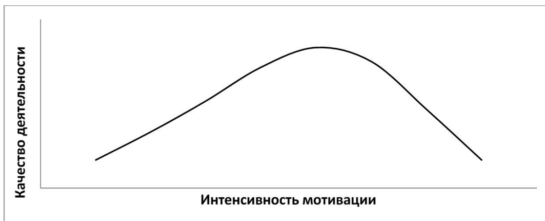
Рис. 1.2. Кривая, отражающая закон Йеркса–Додсона

снижается». Графически, в самом общем виде, это выглядит как перевернутая парабола (рис. 1.2).