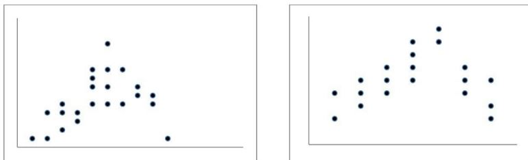
Рис. 1.1. Варианты диаграмм совместного рассеивания точек (каждая точка – испытуемый) в двумерном исследовании

Количественным выражением такого вида связи является коэффициент корреляции.