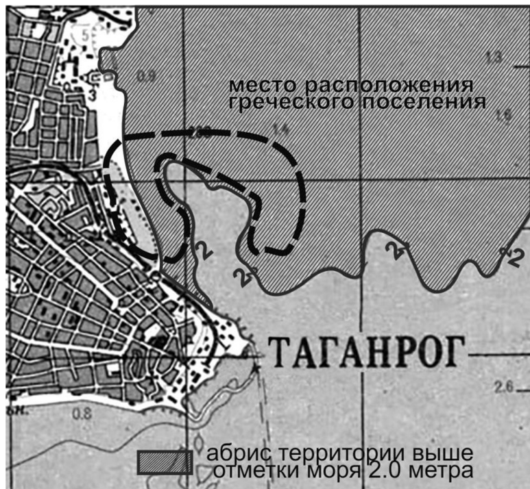
Илл. 1. Версия расположения греческого поселения VII – IV в. до н.э.

Академик А.В. Бунин считает: «Планировка архаичного периода также остается неясной, хотя для понимания ее довольно значительный материал дают священные участки и акрополи, формировавшиеся в VII в. и VI в. до н.э. К это-