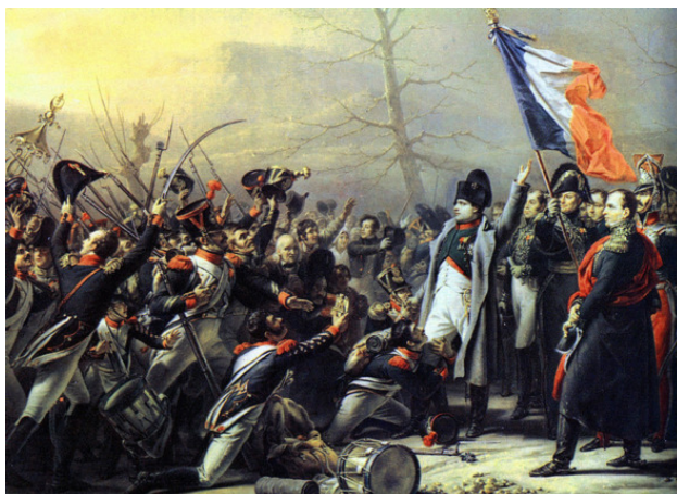
Возвращение Наполеона с Эльбы. Встреча с 7 полком линейной пехоты под Греноблем. Художник Карл Штейнбен.