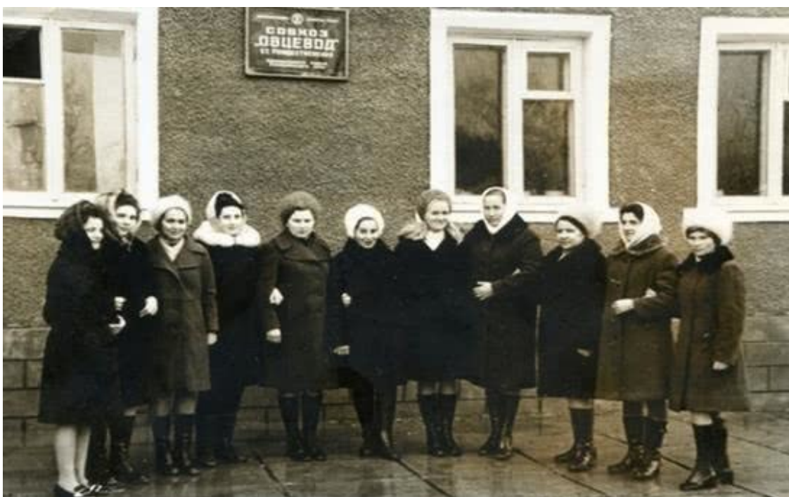
Бухгалтерия совхоза «Овцевод»

Шестнадцатого августа директор так тепло меня принял, что у меня развеялись все сомнения. Пообещал решить и жилищный вопрос. В станице совхоз строит улицу переселенческих домиков – Молодёжную, вот там и нам выделяют домик. Слава Богу, всё складывается прекрасно.