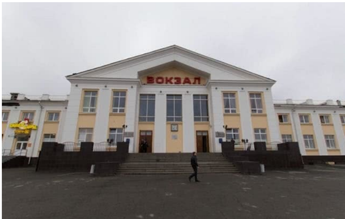
Вокзал Нижнего Тагила

Стоя на ступеньках вокзала, можно было увидеть просторную привокзальную площадь и широкую улицу, уходящую в глубь города. Я обнял за плечи Лену и Серёжу: