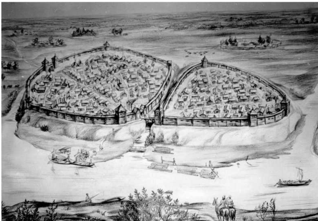
Древний Туров в начале XIII в. (реконструкция П. Ф. Лысенко, художник Е. Г. Коробушкин)

Наиболее полно освещаются события Волынской и Туровской земель в Ипатьевской летописи. В связи с разными событиями Туров упоминается в ней 29 раз. Дважды он назван княжеством и четыре раза волостью. Это свидетельствует о столичном положении города, возглавлявшего самостоятельное княжество. Семь раз упоминается о передаче Турова сыновьям, родственникам и союзникам великого князя киевского. Шесть раз упоминается в связи с военными событиями, осадой города, участием туровских князей в военных походах. Один раз упоминается в связи с событиями в семье туровского князя, но непосредственно сам город упоминается лишь четыре раза. В остальных случаях речь идет о перемещениях на княжеских престолах, политических или семейных событиях, изредка о природных явлениях. Поэтому ввиду случайности, краткости и отрывочности летописных сообщений о Турове восстановить жизнь древнего города по письменным источникам практически невозможно. Для того чтобы восполнить недостаток сведений, необходимо привлекать источники другого рода. Самыми достоверными являются археологические исследования.