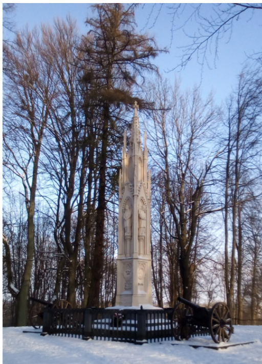
г. Багратионовск. Памятник Славы русского оружия

О, как хочу я любоваться Сияньем солнечного дня! Любуясь, просто наслаждаться Природой, что вокруг меня.