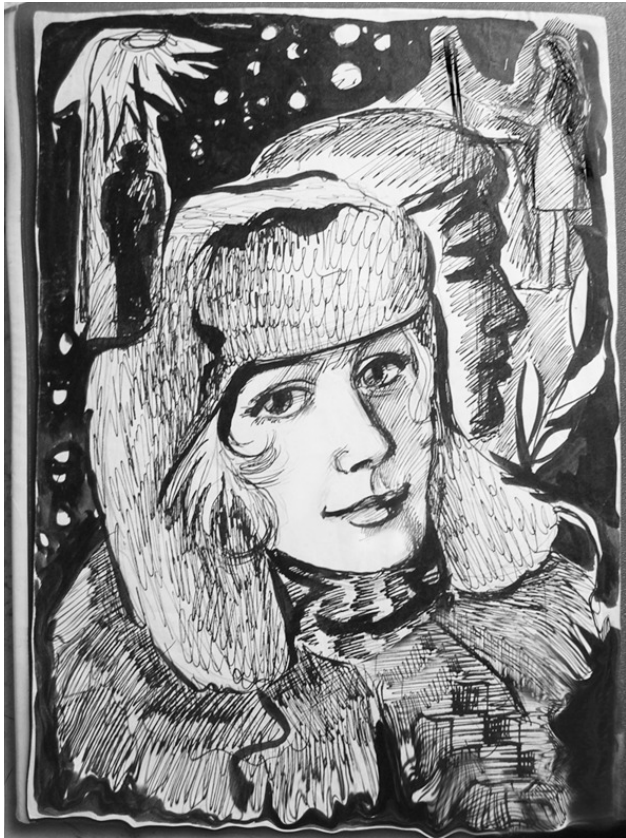
Иллюстрация – Людмила Сотникова