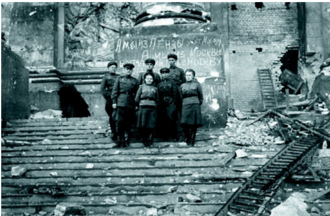
Вот она знаменитая ПЕЧАТЬ НА РЕЙХСТАГЕ!