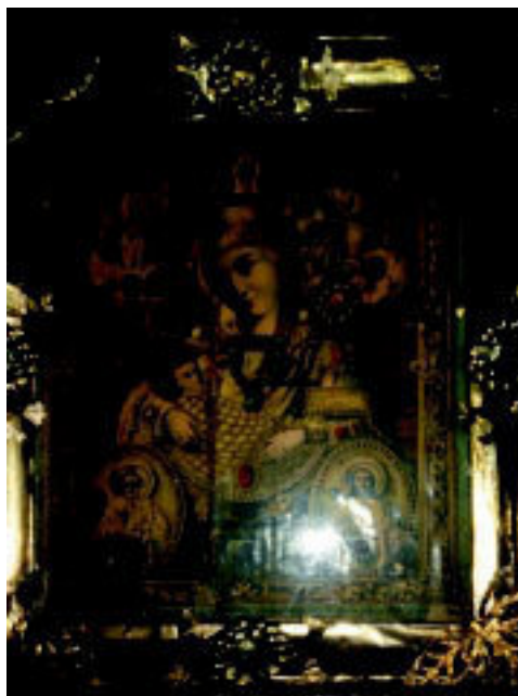
Хранительница семьи Осиных во многих, многих поколениях.