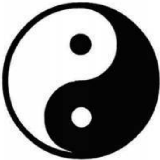
Рисунок 1. Тайцзи