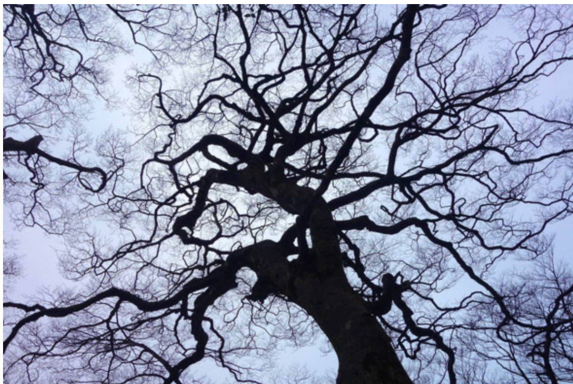
Древесные ветки, напоминающие пульсирующие кровеносные сосуды