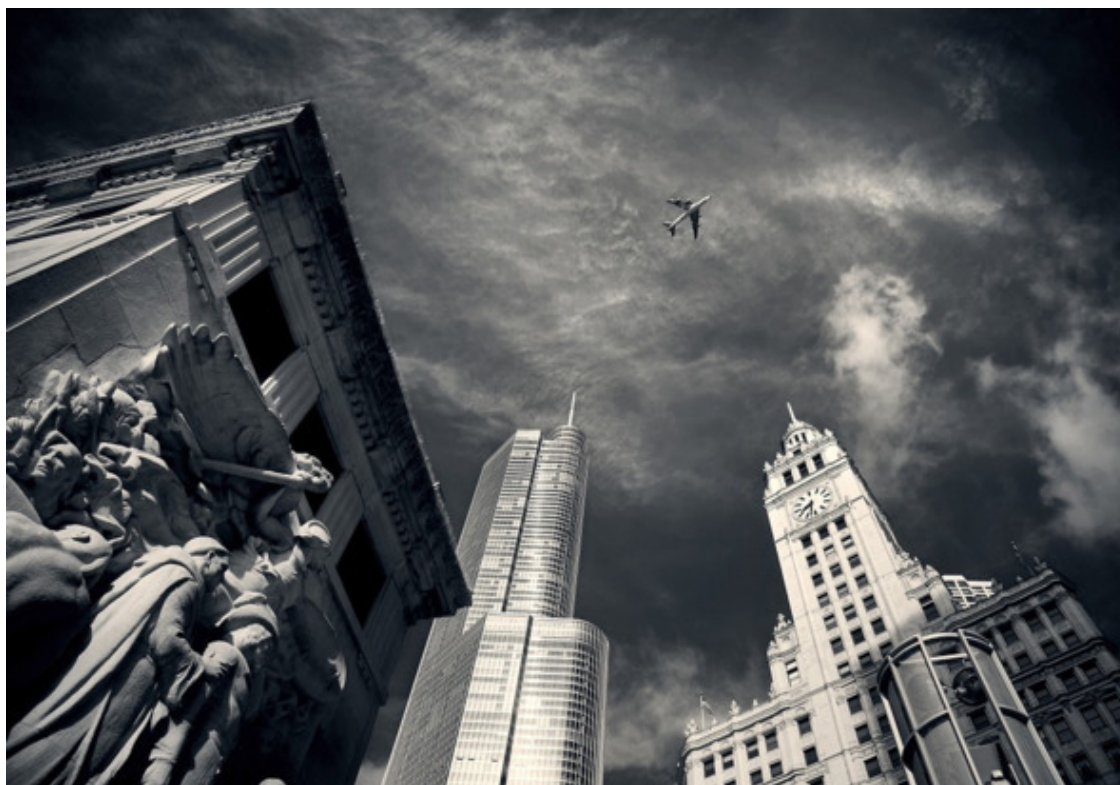
Чикаго, городской ландшафт