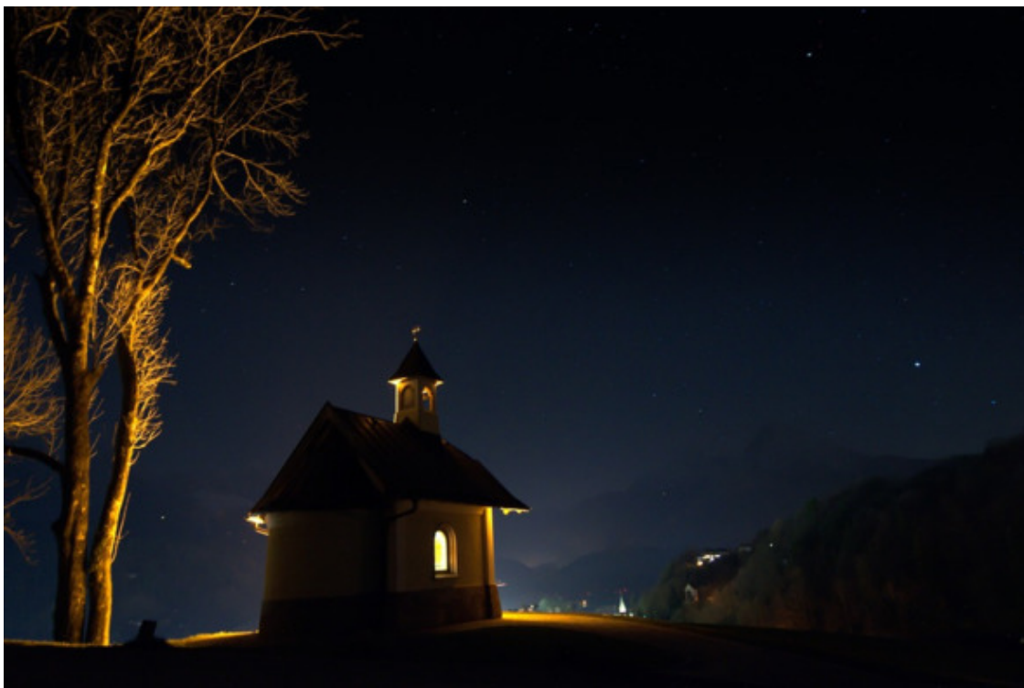
Часовня на фоне ночного неба