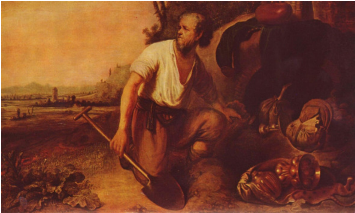
Притча о зарытом сокровище. Харменс ван Рейн Рембрандт. Вторая треть 17 века

Отзывы людей я сопровождал необычными фотоснимками природных ландшафтов и если к ним присмотреться внимательно, то можно ощутить мистическое духовное начало, заложенное в самой природе, которое чаще бывает недоступным для нашего обывательского взора.