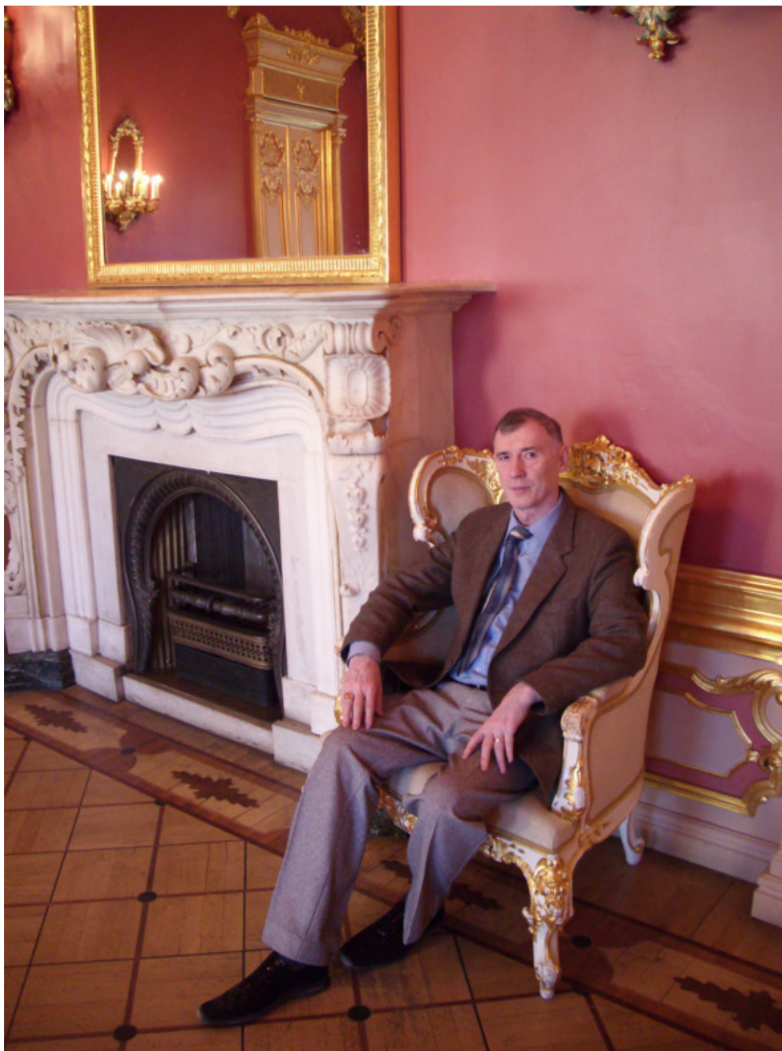
В. И. Жиглов, 2011

Валерий Иванович Жиглов – автор свыше ста научных работ и ряда монографий, а также многочисленных книг в том числе переведённых на иностранные языки и предназначенных для широкой аудитории, которые неоднократно входили в лидеры продаж и занимали призовые места. Имеет учёные степени и государственные награды.