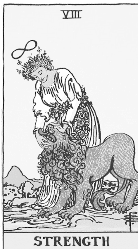
Райдер—Уэйт Новая нумерация