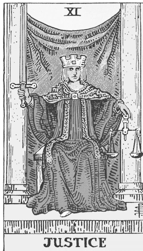
Райдер—Уэйт Новая нумерация