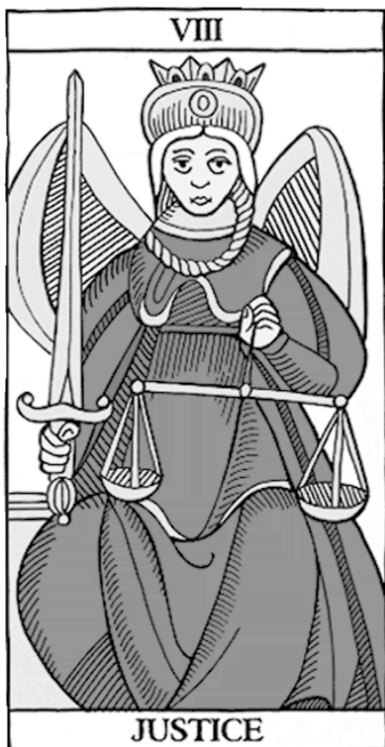
Марсельское Таро Традиционная нумерация

Уэйт назвал эту карту «Влюбленные» и выразил в ней идею чистой любви Адама и Евы, возникшей еще до изгнания из рая. Он также поменял последовательность карт Старших Арканов, переставив местами Справедливость и Силу. Можно предположить, что мотивом к этому послужило его собственное восприятие Каббалы как ключа к пониманию карт. Позднее другой знаток Каббалы и создатель новой колоды Алистер Кроули отверг эту идею и оставил карты на своих местах.