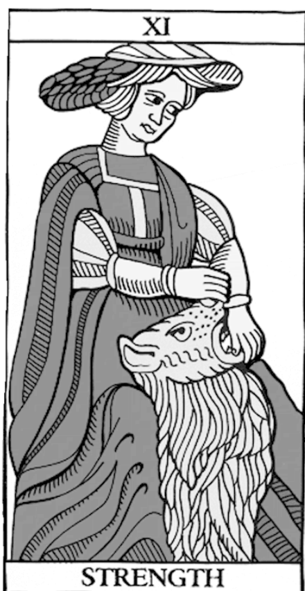
Марсельское Таро Традиционная нумерация