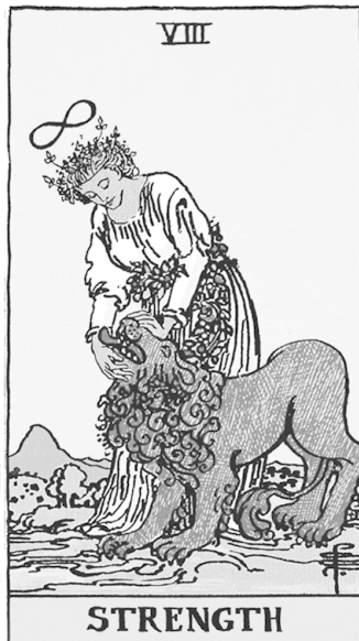
Райдер—Уэйт Новая нумерация