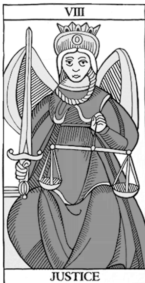
Марсельское Таро Традиционная нумерация