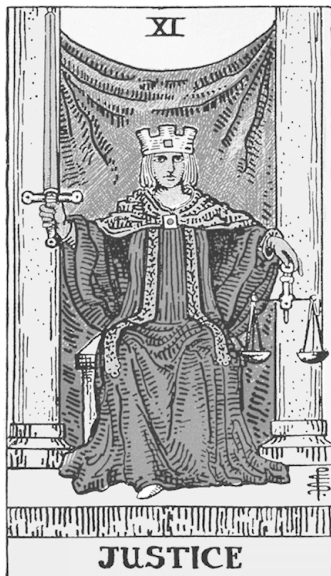
Райдер—Уэйт Новая нумерация