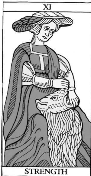
Марсельское Таро Традиционная нумерация