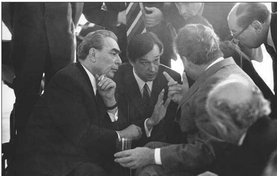
Визит Л.И. Брежнева в ФРГ. 1973 г.

Наша встреча только на первый взгляд казалась случайной. Если браки совершаются действительно на небесах, то она была предопределена. Он – тонкая и одновременно сложная натура. Часто его можно понять, только встав с ним рядом, переняв его мужество и расставшись с суетным. Это трудно, на это надо было решиться. Весь предшествовавший ход моей жизни подготовил меня к такому решению.