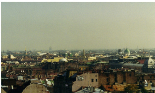
Вид на центр Петербурга с Исаакиевского собора