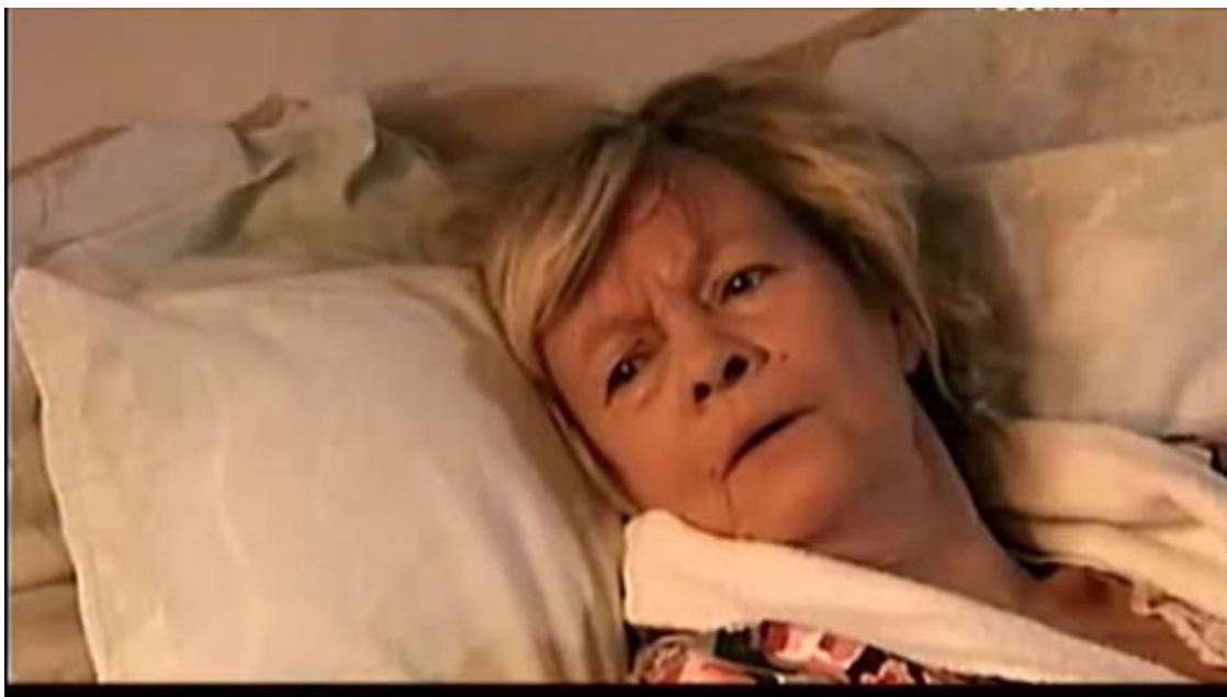
кадр из сюжета киножурнала Фитиль по рассказу

У Помазкова заболела теща. Ну, заболела и заболела, не раз уже такое было. Поохает, да встанет, да с новой силой начинает переедать плешь Помазкову. Но тут – не тут-то было. Теща явно собралась к тестю. Туда, откуда никто не возвращается. Уже неделю не встает, молчит, ничего не ест, даже лекарства. В больницу отказалась переселяться. И Помазкова перестала гнобить, с чего обычно начинала день и заканчивала этим. Помазкову даже скучно стало. А тут еще жена – плачет около матери часами, опухла вся. Все забросила дома, на Помазкова ноль внимания. Все причитает: «Мама, встань, мама, не молчи, мама, как же мы без тебя!»