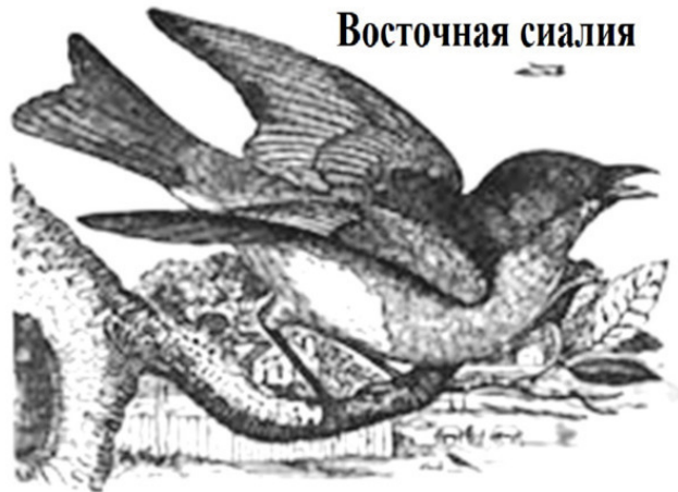
THE BLUE BIRD.

Восточная сialия – Красивое название У этой птицы синий цвет, А песня счастью завет