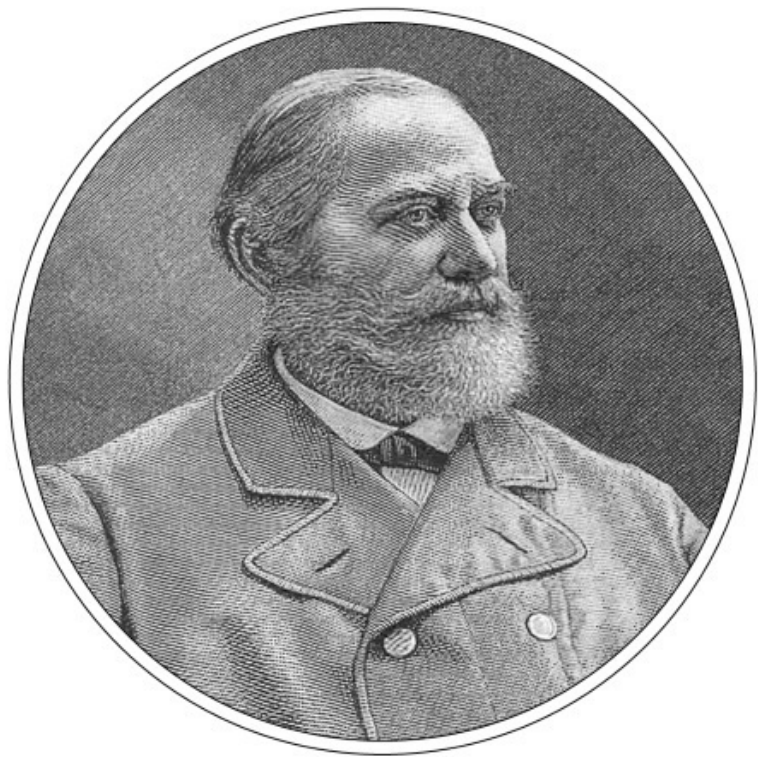
Сергей Михайлович Соловьев (1820–1879)