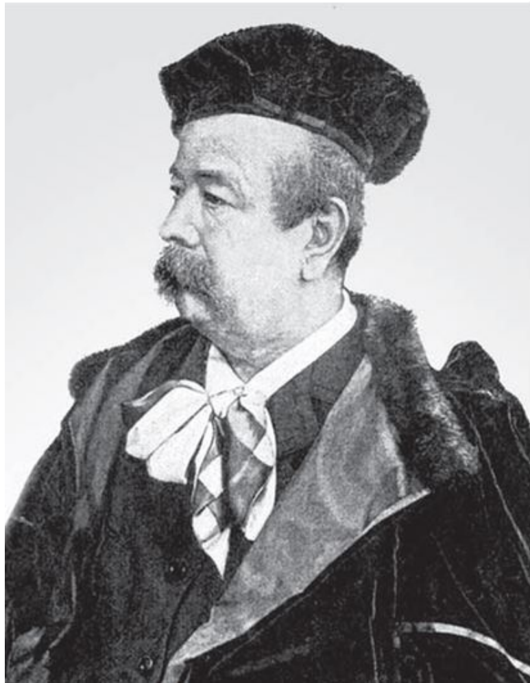
Чарльз-Фредерик Ворт в 1890 году.