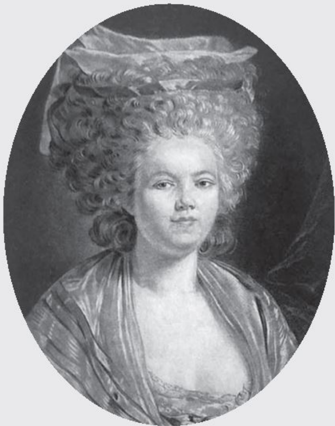
Роза Бертен – «министр моды», 1780-е годы. Гравюра Жанине с портрета художника Ж. Дюплесси.