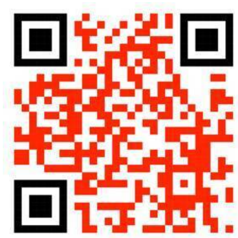
QR «Шаблон таблицы»

Мы идем сверху вниз. Разберем первую строку, она и есть тот самый Максимум Жизни. Сверх цель, превышающая все мои нынешние возможности, тот «Эверест», до которого только смогло дотянуться мое внутреннее позволение после определенной практики погружения. С ней вы познакомитесь ниже.