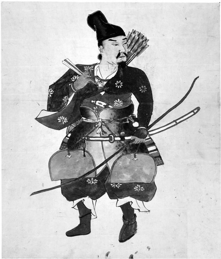
3. Автор неизвестен. Воин-лучник. XIX в.