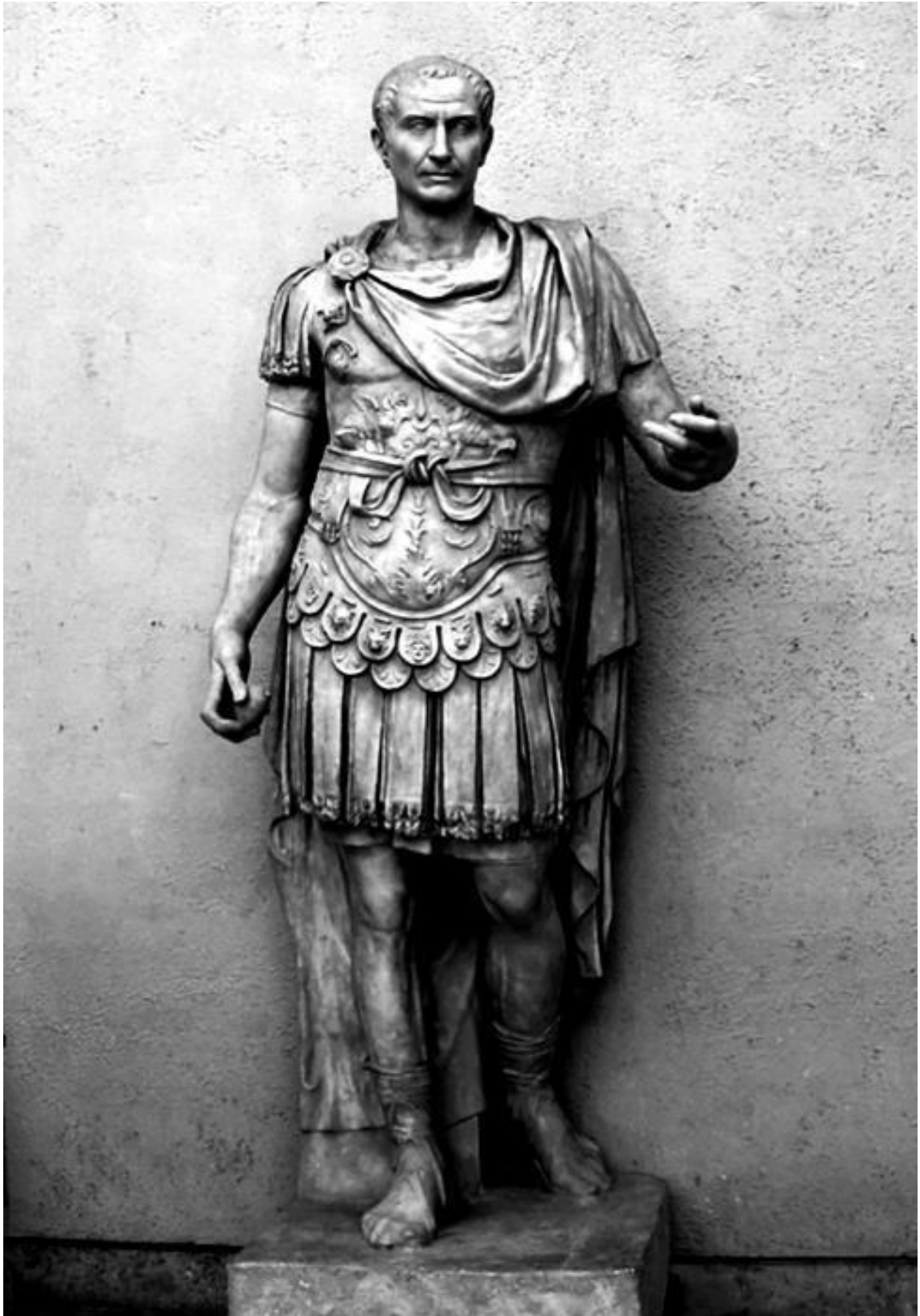
Юлий Цезарь. Римская статуя I века до н. э.

Для Цезаря завоевание острова стало частью покорения северных варваров и распространения на них римского правления. Нетронутая земля, не страдающая от избытка лесов и болот, отличалась плодородием. Климат, хотя и далеко не мягкий, был ровным и здоровым. Местные жители, пусть грубые и неотесанные, представляли определенную ценность для использования