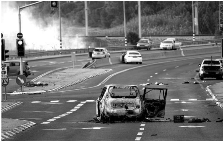
Сгоревшие и брошенные автомобили на дороге в Сдероте (Израиль)

Противники Израиля активизировались на еврейские праздники еще 20 лет назад – поэтому у нас на такие даты часто случались усиления.