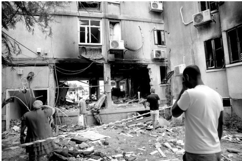
Поврежденный дом после попадания ракеты из сектора Газа в Ашкелоне в Израиле

Как сообщает издание, в случае наступления Израиля ХАМАС может обратиться к тактике ливанской группировки «Хезболла», которую организация использовала в войне с ЦАХАЛ в 2006 году. Боевики могут нанести неожиданный удар по целям вдали от линии фронта с применением продвинутого оружия, в то время как израильская армия будет находиться на их территории 14 .