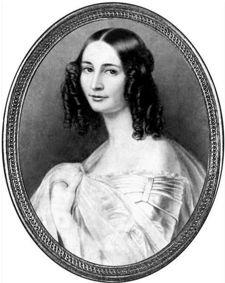
Эрн. Ф. Тютчева, вторая жена поэта. Портрет работы Ф. Дюрка (масло). Мюнхен, 1840 г.