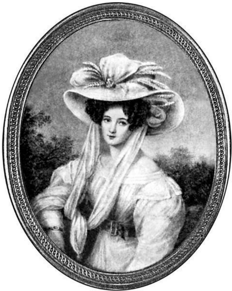
Элеонора Тютчева. Миниатюра И. Шелера, 1830-е годы.