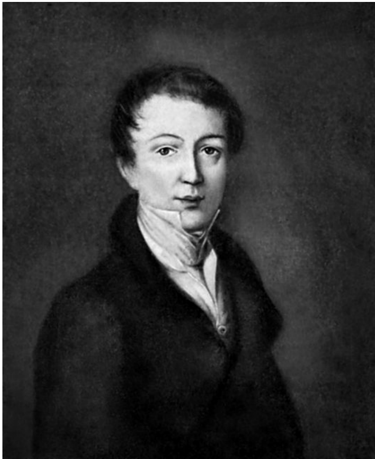
Ф. И. Тютчев. Портрет маслом работы неизвестного художника. Начало 1820-х годов.