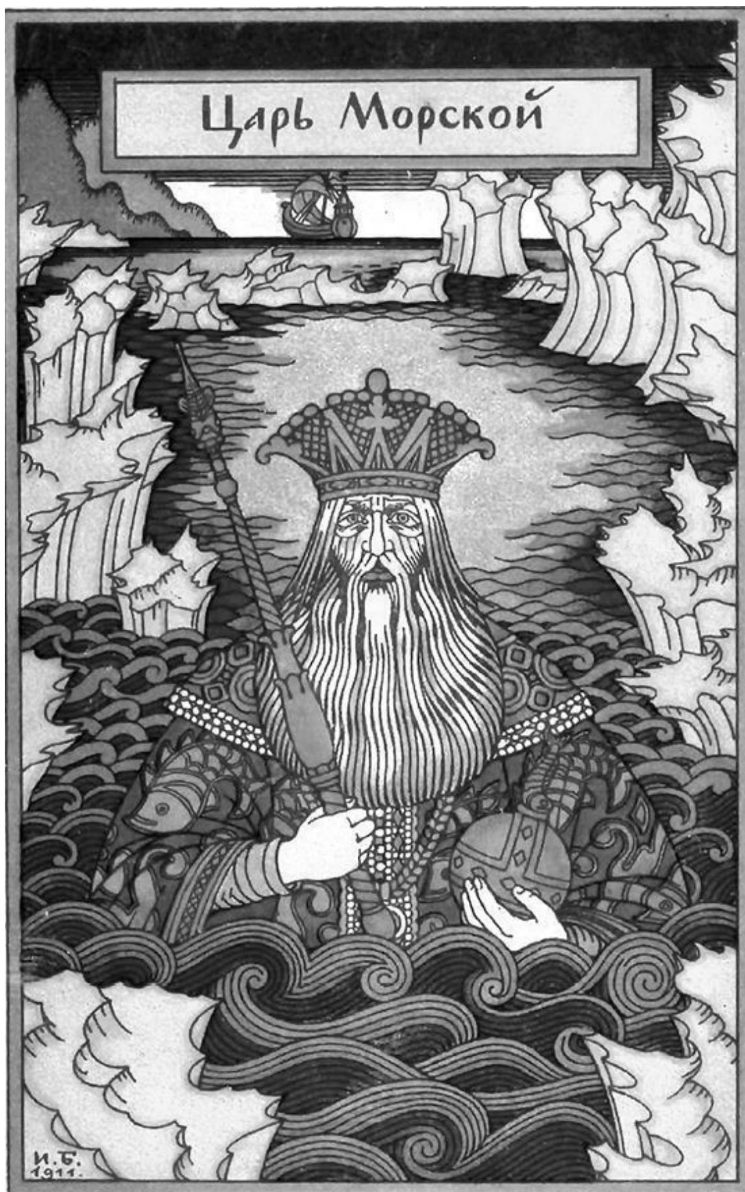
Уборы внутренни покров черепокожных Бесчисленных зверей во глубине возможных.