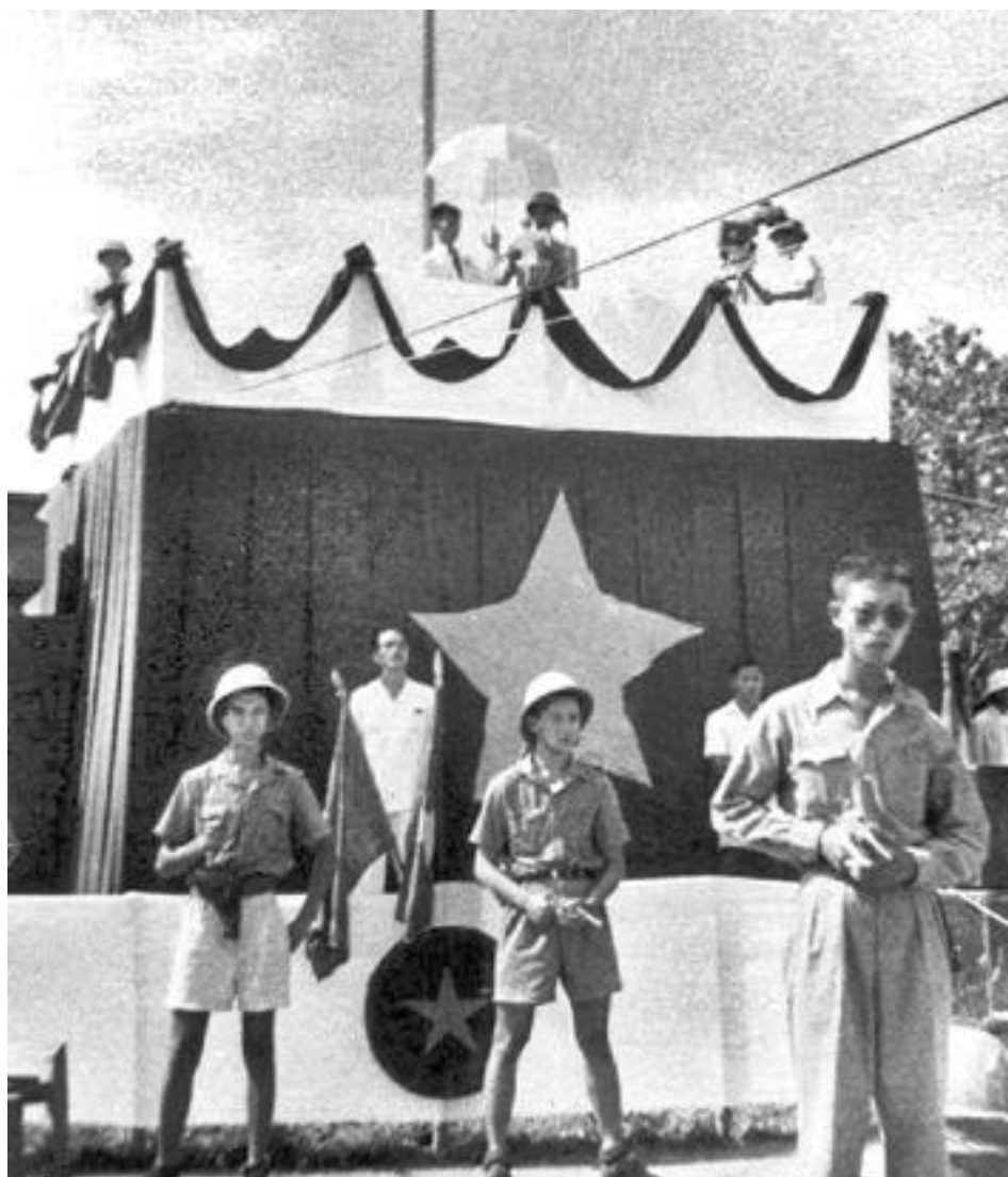
Хо Ши Мин выступает с декларацией о независимости Вьетнама. Ханой, 2 сентября 1945 г.