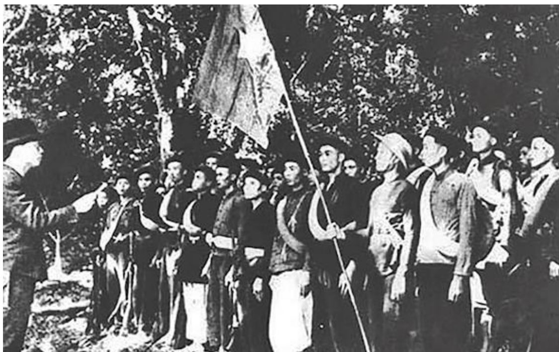
Во Нгуен Зиап перед строем первого отряда пропаганды и освобождения Вьетнама, 22 декабря 1944 г.

19 декабря 1944 года Хо приказал Зиапу создать первые подразделения пропаганды и освобождения Вьетнама, ставшие предтечей Народной Армии Вьетнама (НАВ), регулярных вооруженных сил Северного Вьетнама. Важно обратить внимание на тот факт, что даже в названии создаваемых коммунистами частей недвусмысленно соединены война и политика – это сочетание стало впоследствии «фирменным знаком» северовьетнамской армии. От создания вышеназванных подразделений начинается отсчет полководческой карьеры Зиапа. Военные кампании, которые пришлось вести Вьетминю во время Второй мировой войны, не отличались особой жестокостью. Так, в августе 1945 года предводительствуемым Зиапом вооруженным силам почти без крови удалось захватить власть на территории Северного Вьетнама. Так называемая Августовская революция оказала сильнейшее влияние на Зиапа и его стратегию ведения войны.