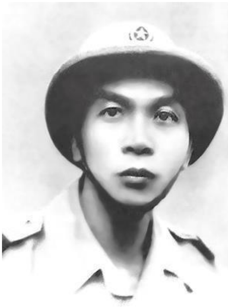
Зиап в молодости

В 1927 году Зиап в знак протеста против несправедливостей, чинимых властями, вместе с остальными учащимися лица принял участие в акции неповиновения «долой школу». Затея школьников представляла собой «детский крестовый поход» и, как и то давнее мероприятие более чем семисотлетней давности, быстро сошла на нет. Зиапа выгнали из лица, и молодому человеку пришлось отправиться домой, в родную деревню. Как-то навестить Зиапа в Ан-Кса заехал один его товарищ из Хюэ. Они долго беседовали о политике и о революции. Прежде чем друзья простились, Зиап стал членом партии Таи-Вьет, созданной для того, чтобы «...осуществить сначала революцию в своей стране, а затем понести ее за пределы Вьетнама всему миру». Хотя Тан-Вьет не являлась коммунистической организацией, члены ее в значительной степени сочувствовали идеям марксизма.