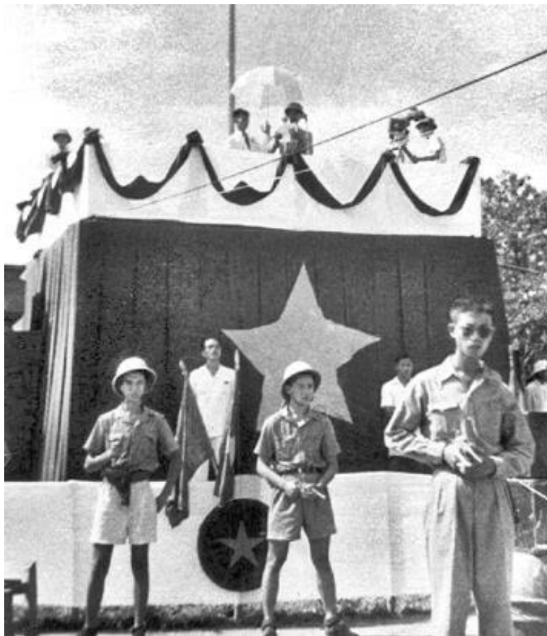
Хо Ши Мин выступает с декларацией о независимости Вьетнама. Ханой, 2 сентября 1945 г.

Благодаря тому, что почерпнул будущий «архитектор