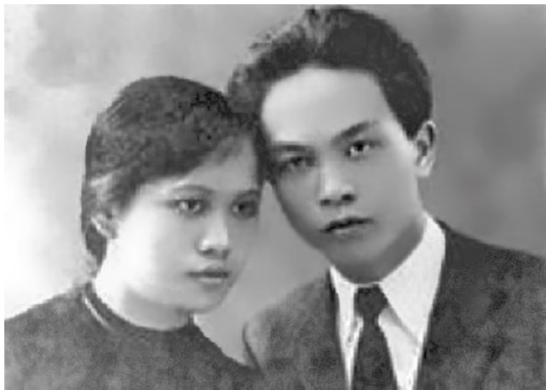
Зиап с Минь Тай

для выработки политики Вьетминя по отношению к крестьянству».