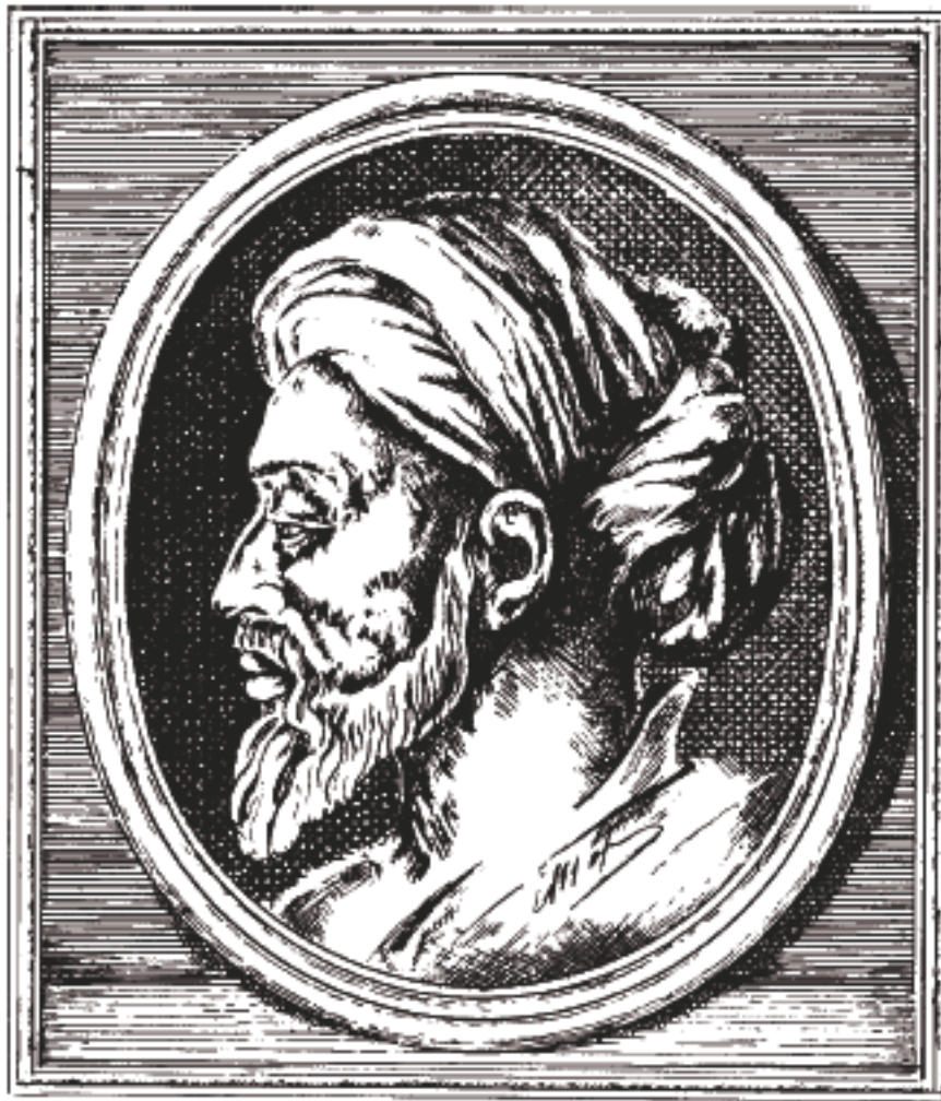
Ибн Сина. Средневековая гравюра