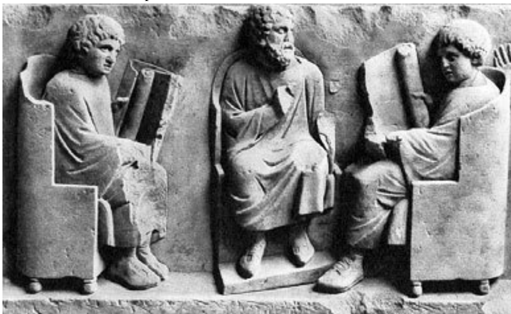
Философ с учениками. Рельеф. Поздний Рим

В наше время, наверное, лишь специалисты знают имя Боэция – философа, авторитет которого в период раннего Средневековья уступал разве что лишь авторитету Блаженного Августина. Аниций Манлий Северин Торквай Боэций (таково его полное имя) родился в Риме около 480 года, в семье родовитого римского сенатора. Мальчик рано лишился отца, и его взял на воспитание Квинт Аврелий Меммий Симмах – глава Сената и префект Рима, один из самых образованных людей своего времени, оказавший на юного Боэция значительное влияние.