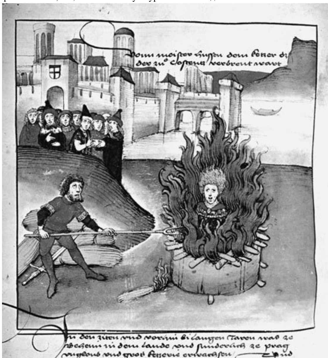
Сожжение Гуса. Миниатюра из хроники Шницера

Счастливым периодом в истории Чехии, которая в Средние века не раз теряла независимость, было время правления короля Карла IV (1347–1378), прозванного в истории «отцом Чехии и отчимом Германии». Он заботился об усилении и процветании чешского королевства, учредил в Праге университет, а также основал Эммаусский монастырь, в котором богослужения должны были совершаться на славянском языке, понятном народу. В Праге организовалась христианская община, которая нуждалась в особом месте для отправления своих религиозных служб. Таким местом стала Вифлеемская часовня, которую в 1394 году выстроил богатый купец Кржиж вместе с любимцем и советником короля Яном фон Мюльгеймом – одним из предшественников Яна Гуса. Часовня стала своего рода центром оппозиции против папы и церкви, и в ней впервые раздалось обличительное слово Я. Гуса, всю жизнь свою отдавшего идее религиозного, национального и культурного освобождения Чехии.