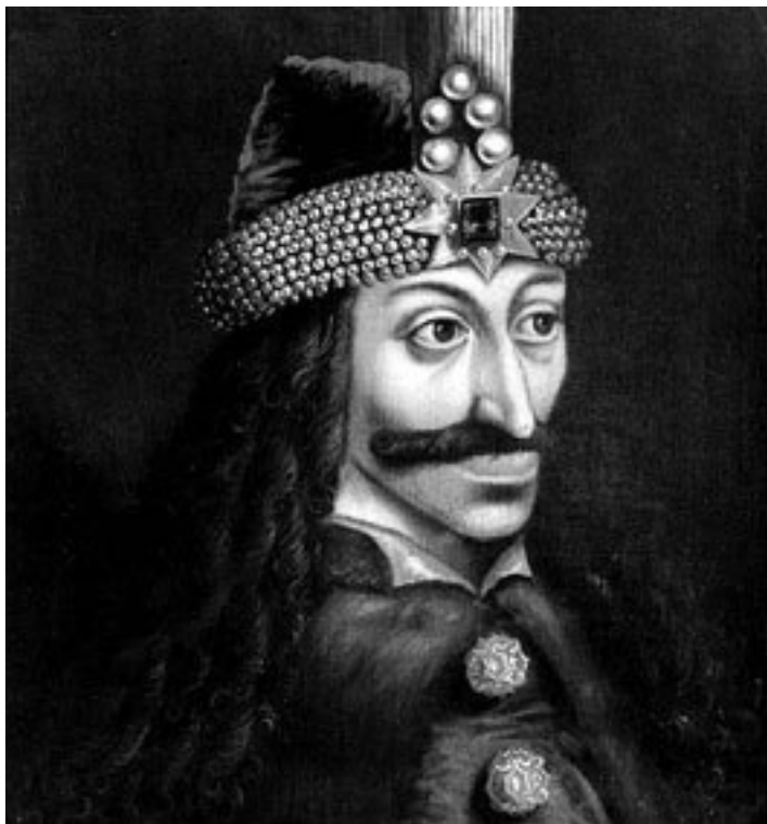
Влад III Цепеш (Дракула)