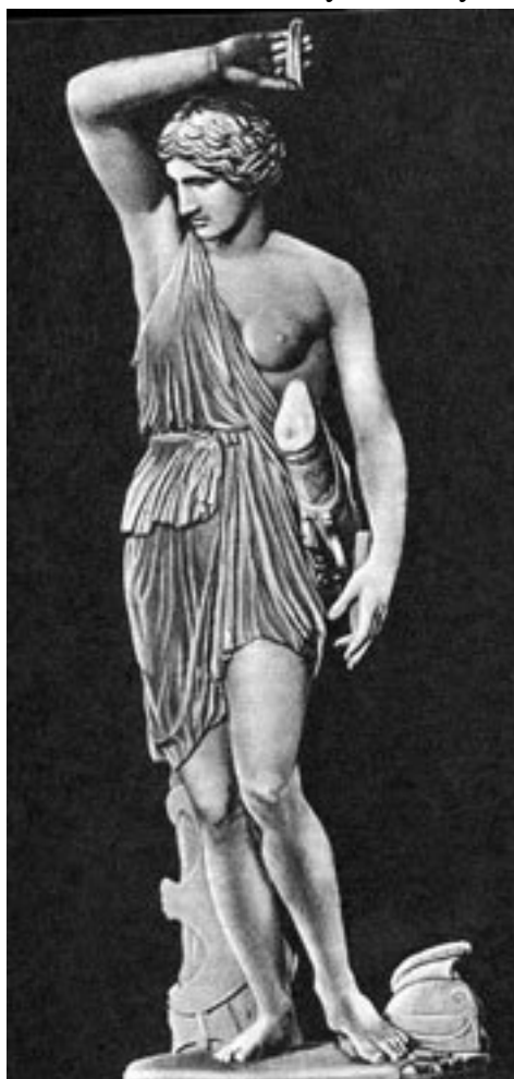
Амазонка. Римская копия статуи Фидия. V в. до н. э.

Ни одна из подлинно достоверных работ Фидия до нас не дошла, и мы судим о них лишь по фрагментам и копиям более поздней эпохи да по изображениям на монетах и рисункам на вазах. Но когда кто-нибудь из поэтов или писателей хотел привести пример художника, которого все и во все времена признавали великим, чаще всего называлось имя именно этого древнегреческого скульптора. Никто из художников Древней Эллады не вызывал своим творчеством таких восторженных отзывов потомков, как Фидий, на долгие годы ставший мерилом творческих дерзаний и побед. Например, римский писатель и ученый Плиний писал: «Никто не сомневается, что Фидий наиболее знаменитый художник у всех народов».