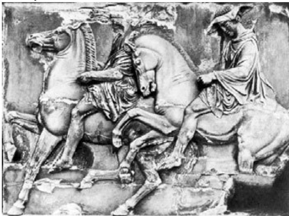
Греческий рельеф V в. до н. э.

Анаксагор был родом из небольшого торгового городка Клазомен. Все источники утверждают, что он получил большое наследство, но вскоре утратил его, так как ничем, кроме науки, не занимался. Еще в молодости будущий философ переехал в Афины, где и прожил большую часть своей жизни. Имя Анаксагора в истории афинского государства V века до нашей эры оказалось неразрывно связанным с именем Перикла. Данные об их дружбе и о том влиянии, какое оказал молодой философ на лидера афинской демократии, подтверждаются многими свидетельствами. Достоверно известно, что он написал одно философское сочинение, хотя есть сведения, что у него были сочинения и по другим вопросам, например по применению законов перспективы к театральной живописи.