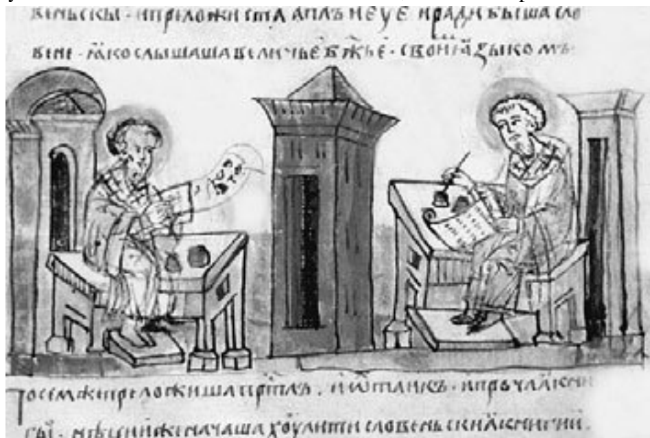
Кирилл и Мефодий переводят книги на славянский язык. Радзивилловская летопись

Братья пользовались известностью как люди умные и образованные, а Константин за свою ученость был даже прозван философом. Он находился в тесных отношениях с Фотием (впоследствии патриархом Константинопольским), а это был человек, по уму и образованию превосходивший многих своих современников. Константин пользовался его уроками, знал язык славян, хазар и еврейский, было ему известно и самаритянское наречие. Он занимал важные посты в византийской государственной иерархии, ездил с ответственными миссиями к арабам, хазарам и западным славянам. Например, когда хазары, обитавшие между Волгой и Азовским морем, попросили византийского императора прислать им ученого богослова для разрешения теологических споров, Михаил III отправил к ним Константина, и тот успешно выполнил это поручение. А после завершения своей арабской миссии он приехал в монастырь к Мефодию. В науке существует мнение, что именно тогда в монастыре и были созданы славянская азбука и письменность для балканских славян, живших в пределах Византии.