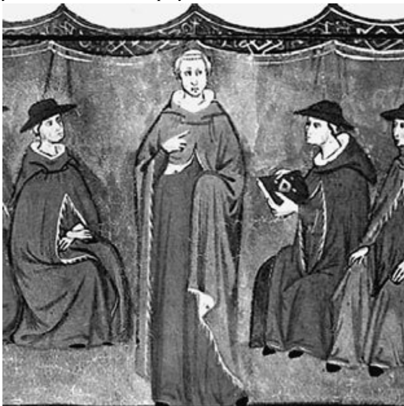
Избрание папы Иоанна XXIII. Миниатюра XIV в.