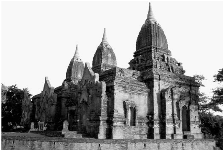
Храмовый комплекс Пьятонзу в Пагане

Так повествует бирманская «Большая великая государева хроника Стеклянного дворца», хотя современные ученые считают, что версии рассказанных в ней событий не всегда соответствуют действительности. Например, другие хроники рассказывают, что перед Анирудой стояла задача захватить важнейшие торговые пути – реку Иравади и южное побережье Бирмы, где тогда соперничали города Татон и Пегу. Таким образом, в поход правитель Паганского царства отправился не за рукописями, а захватить их ему помог случай.