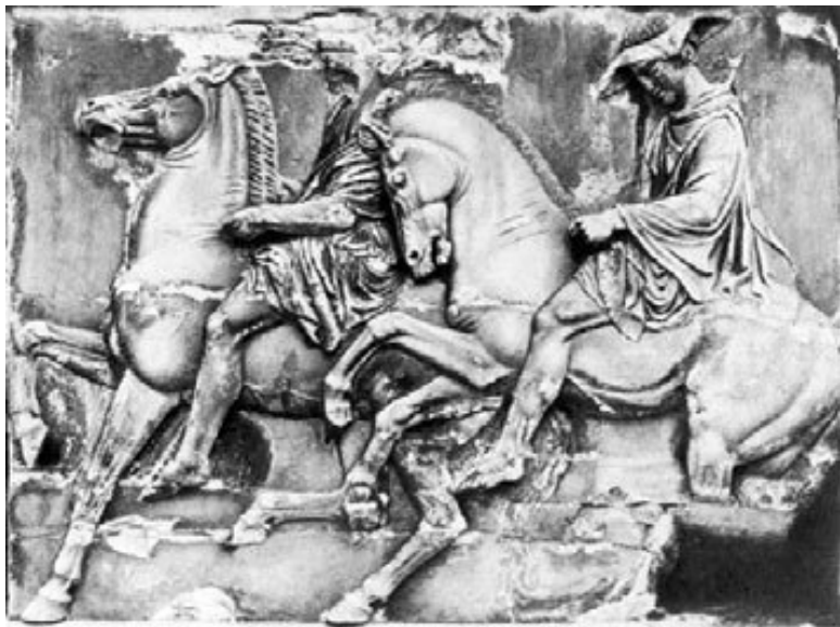
Греческий рельеф V в. до н. э.

Рассказы о суде над Анаксагором относятся к позднему времени и имеют большей частью легендарный характер, так как нет конкретных сведений ни о времени его проведения, ни о формулировке обвинения, ни о приговоре. Нет даже точных сведений о том, состоялся ли этот суд на самом деле или Анаксагор покинул Афины еще до процесса. Судя по тем отрывочным сведениям, которые все же дошли до нас, философ обвинялся в безбожии, но историки предполага-