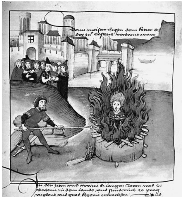
Сожжение Гуса. Миниатюра из хроники Шницера

Образование свое Ян Гус завершил в Пражском универ- ситете, в котором впоследствии занял должность ректора. Одновременно со службой в университете Я. Гус был про-