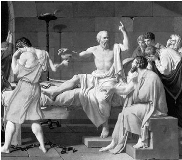
Смерть Сократа. С картины Ж.-Л. Давида. 1787 г.

О философе и его учении накопилась огромная литература, тем не менее нет фигуры более загадочной, чем Сократ. Сам он не написал в своей жизни ни строчки и потому не оставил письменного наследия 2 . О его жизни и деятельности мы узнаем главным образом из сочинений его учеников и