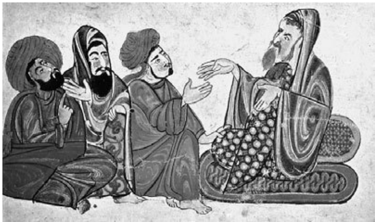
Ученый с учениками. Восточная миниатюра

номом, минералогом, географом, историком. В решении ряда научных проблем аль-Бируни намного опередил свое время, например, признавал основательность взглядов индийских астрономов о движении Земли вокруг Солнца и творчески развивал их. Он вычислил радиус Земли, с удивительной для своего времени точностью определил удельный вес многих металлов и минералов, высказывался о притяжении предметов к центру Земли, правильно предположил, что долина реки Инд в прошлом была морским дном и т. д.