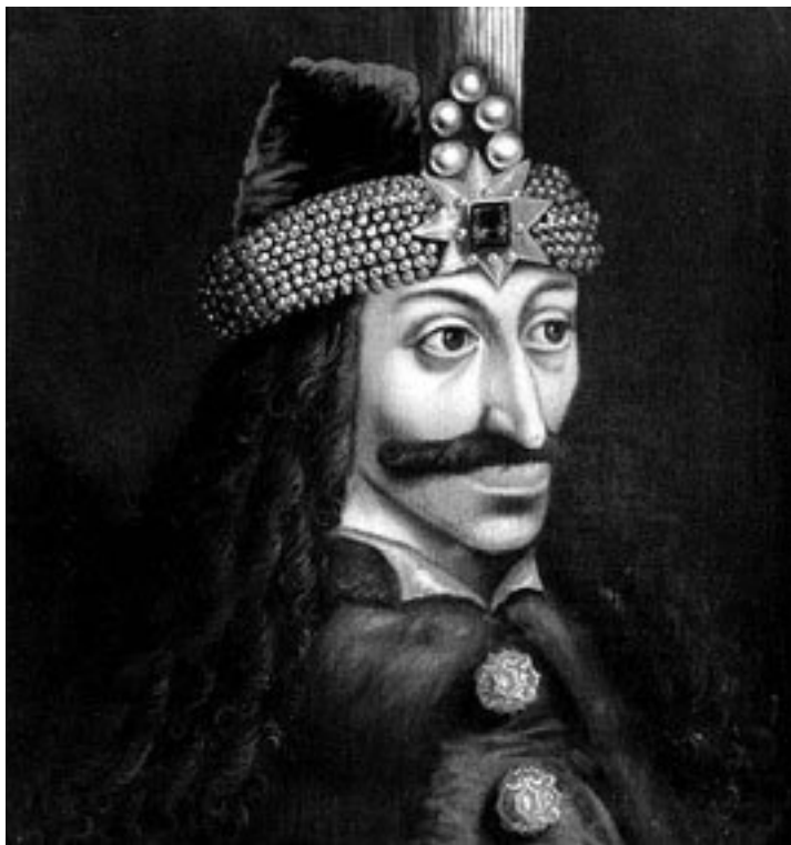
Влад III Цепеш (Дракула)

Почти все, что связано с именем Влада III Цепеша, окутано тайной, вплоть до места захоронения, так как его могилу в Снаговском монастыре многие считают кенотафом. Отец Влада Цепеша принадлежал к рыцарскому полувоенному-полумонашескому ордену Дракона, основанного гер-