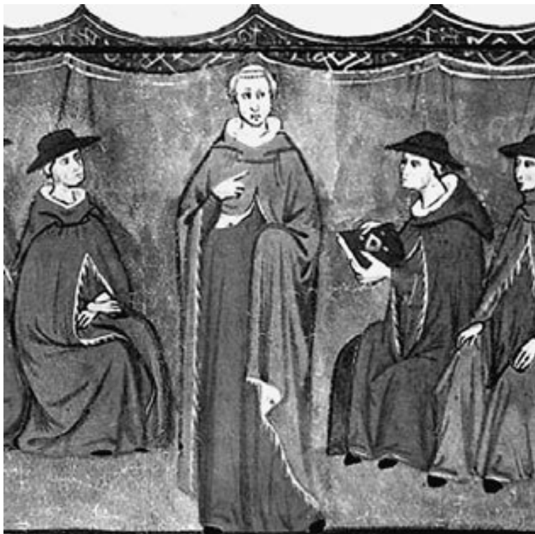
Избрание папы Иоанна XXIII. Миниатюра XIV в.

ном несколько душеспасительных бесед. И так как она была очень красноречива, то в скором времени он отправился в университет Болоньи и поступил на теологический факультет.