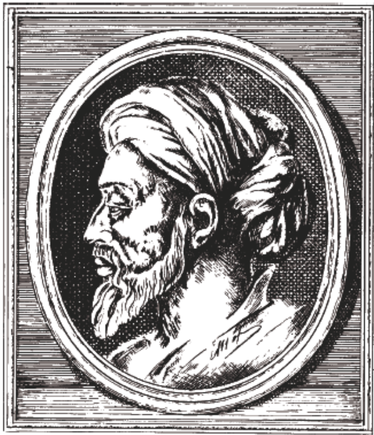
Ибн Сина. Средневековая гравюра

Еще в юношеские годы Ибн Сина прославился как вра-