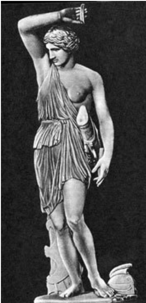
Амазонка. Римская копия статуи Фидия. V в. до н. э.