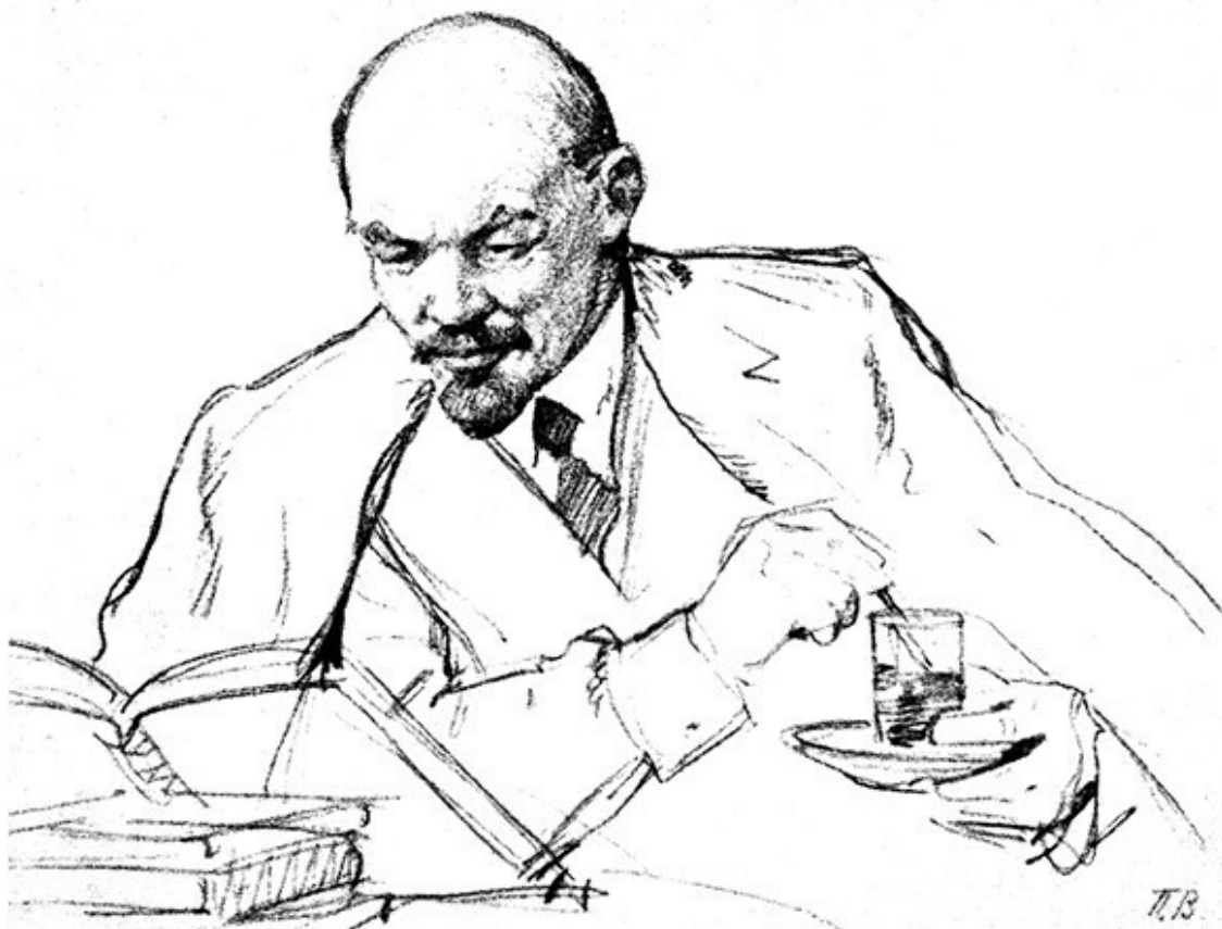
Ленин за работой

Такое место, понятно, мимо ленинского глаза никак пройти не могло. В 20-м году Владимир Ильич самоличным декретом объявил здешние места заповедными. Чтоб, значит, промышленников и хитников всяких по загровку, а сберечь эти горы для научности, на предбудущие времена.