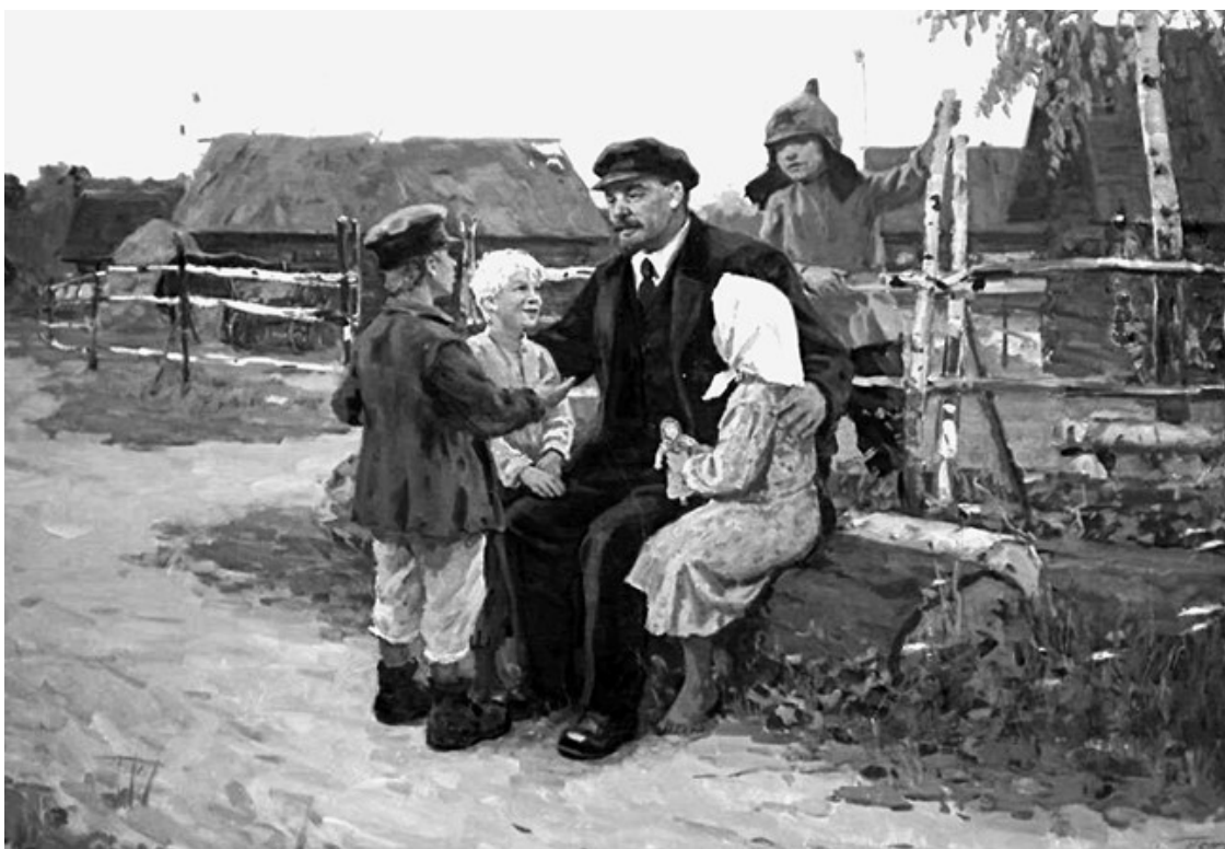
Ленин и крестьянские дети

– Мужика теснить ты права не имеешь. Потому мужик – большая сила в государстве, от него и хлеб идет. Значит, как друга своего я наказать тебя должен примерно.