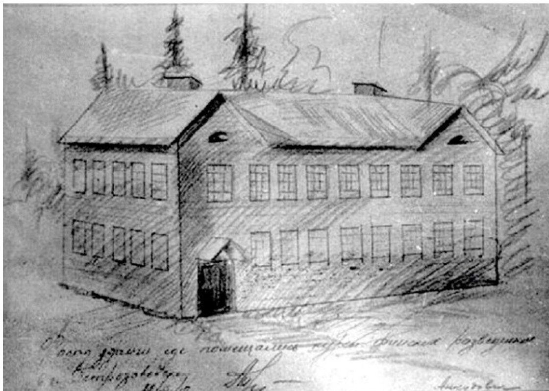
Рисунок здания Петрозаводской разведшколы. Автор – курсант А.В. Анкудович, июль 1942 г. Здание сохранилось до наших дней.

Всего, по разным данным, в школе было подготовлено от 80 до 300 агентов 7 . Однако точную численность подготовленных курсантов очень сложно определить, так как многие курсанты, скажем, Рованиемской разведшколы, проходили обучение в Петрозаводской разведшколе, а их фамилии указываются и в той, и другой школе.