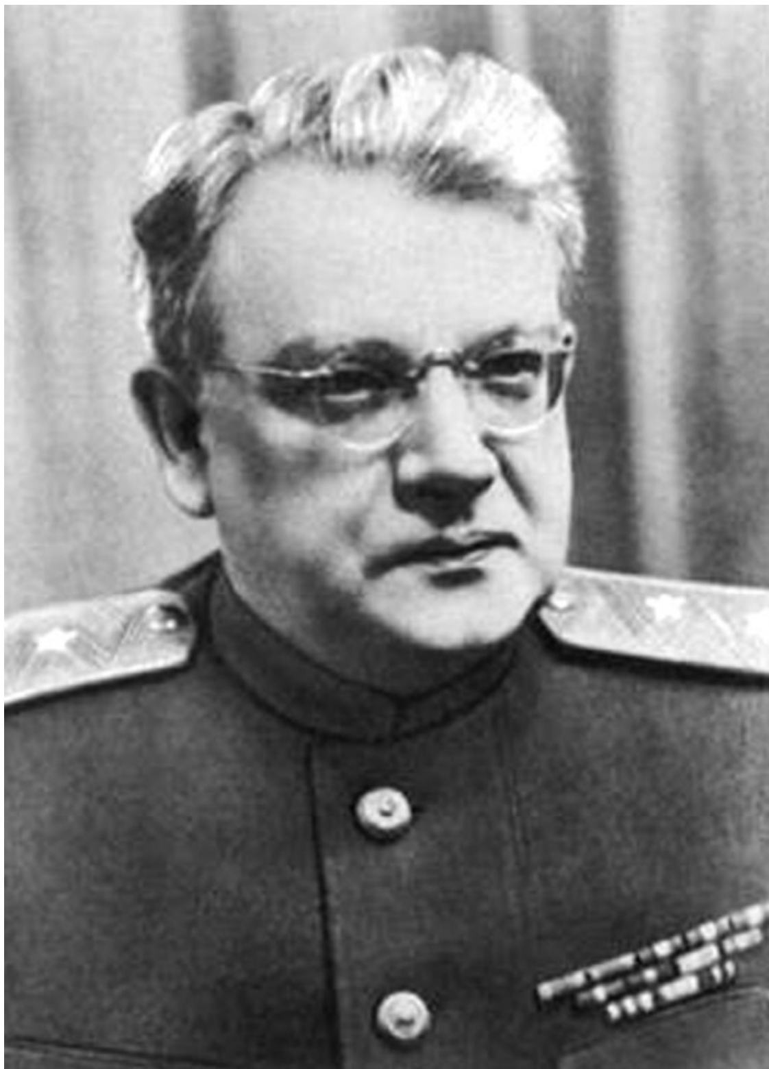
Комиссар госбезопасности, Начальник 2-го Управления НКВД СССР П.В. Федотов