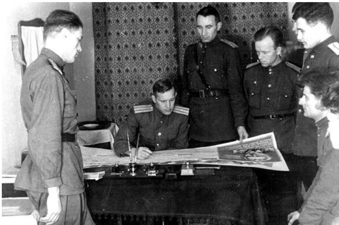
1-я Московская школа ГУКР НКО СМЕРШ. Скоро будет новая стенгазета

22 июня 1941 г. войска фашистской Германии вторглись на территорию СССР. Свои основные устремления спецслужбы фашистской Германии направляли на действующую Красную армию. Немецкая разведка пыталась внедрять своих агентов в ее ряды, вербовать военнослужащих, имевших доступ к секретной информации. Активно проводились пропагандистские акции с целью разложения личного состава, склонения красноармейцев к переходу на немецкую сторону, совершению враждебных действий.