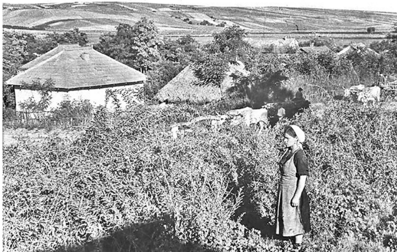
Вид села Ганчеиты

был Григорий Иванович, или больше любил рассказывать и распускать слухи о своей невиданной доброте? Мне кажется, что в чем-то Котовский был гоголевским персонажем. Что-то у него было от Ноздрева, хотя бы в желании прихвастнуть.