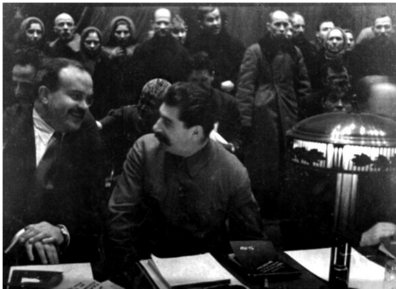
С Вячеславом Молотовым

тете покинул его ради революционной работы. Не имел высшего образования и автор «теории перманентной революции» Троцкий, который был арестован после годичного пребывания в университете Николаева и потом нигде не учился. Не имел законченного высшего образования и «теоретик» Г.Е.Зиновьев. Это не было удивительным: к моменту написания Лениным его письма в партии лишь 5 процентов ее состава имели высшее образование, а 84 – обладали лишь «низшим», «домашним» и подобными видами «образования».