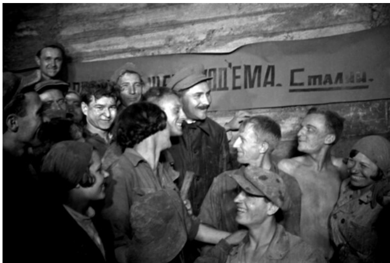
Лазарь Каганович с метростроевцами