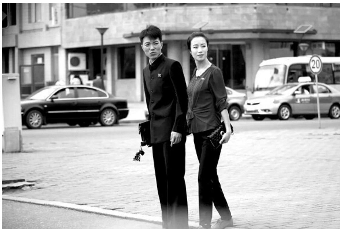
Пхеньян в наши дни

Так как же нам разубедить Недобрых Самаритян, чтобы они не вредили бедным странам, какими бы благородными их намерения не были? И что они могли бы сделать вместо этого? Сочетая историю, анализ современного мира, прогнозы на будущее и предложения некоторых изменений, настоящая книга может дать ответы на эти вопросы.