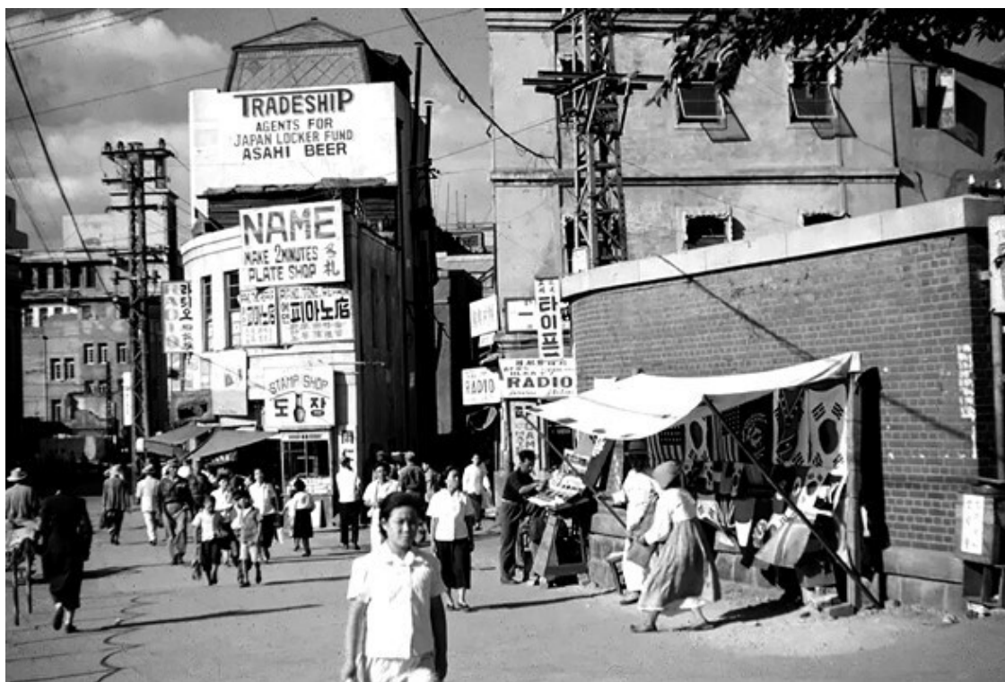
Сеул в 1950-х годах.