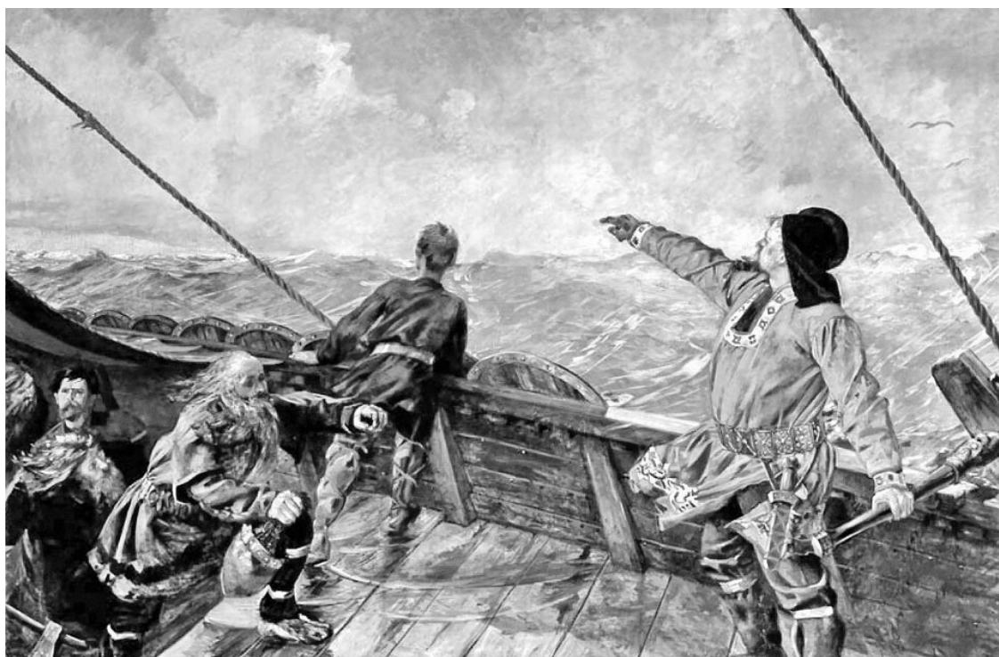
Кристиан Крог. Лейф Эрикссон открывает Америку. 1893

И, наконец, последняя местность, которую посетил отряд, удивила путешественников обилием дикого винограда. Она получила название Винланд, что переводится как «Виноградная страна». Сегодня это место находится на территории канадской провинции Ньюфаундленд и Лабрадор (во всяком случае, в 1960 году археологическое свидетельство раннего поселения викингов было обнаружено в местечке Л'Анс-о-Медоуз 1 на острове Ньюфаундленд). Тамашние реки оказались щедрыми на лосося, с древесиной тоже не было проблем. Поэтому Лейф решил остаться там на зиму.