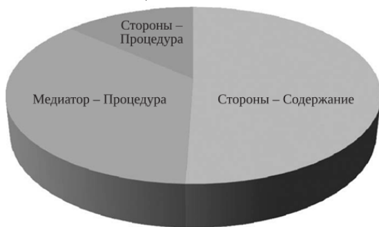
Рисунок 2. Распределение ролей и зон ответственности участников медиации

Таким образом, медиация может быть определена как одна из современных технологий в сфере разрешения правовых конфликтов, сформировавшаяся на базе классического (традиционного) посредничества путем выведения его на профессиональный уровень и повышения степени самостоятельности сторон.