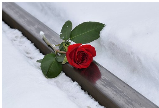
Роза лежит на снегу...