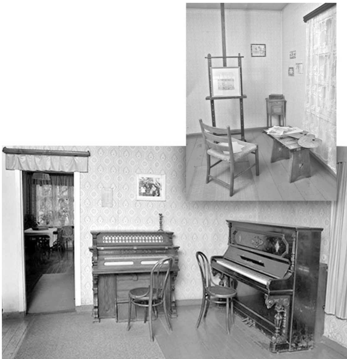
В Доме-музее М. К. Чюрлёниса в Друскининкае. Современный вид

До 1896 года Чюрлёнисы жильё снимали. Но вот что интересно (можно сказать – мистическая история!): сразу после переезда в Друскеники они поселились и какое-то недолгое время жили в одном из тех домов, где сейчас музей.