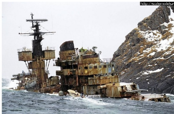
Остов крейсера «Мурманск»

Таращатся вдаль дальномеры, Но пушки уставились в воду. На мостике ржавом пустынно. И крейсер давно не дымит. Крутые норвежские скалы Смогли в штормовую погоду Принять этот гордый красавец. И вот он несчастный стоит.