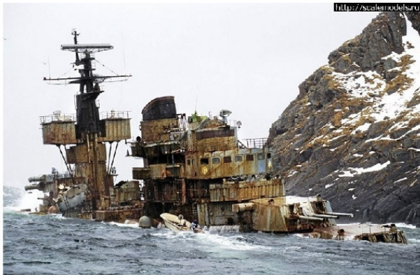
Остов крейсера «Мурманск»

Таращатся вдаль дальномеры, Но пушки уставились в воду. На мостике ржавом пустынно. И крейсер давно не дымит. Крутые норвежские скалы Смогли в штормовую погоду Принять этот гордый красавец. И вот он несчастный стоит.