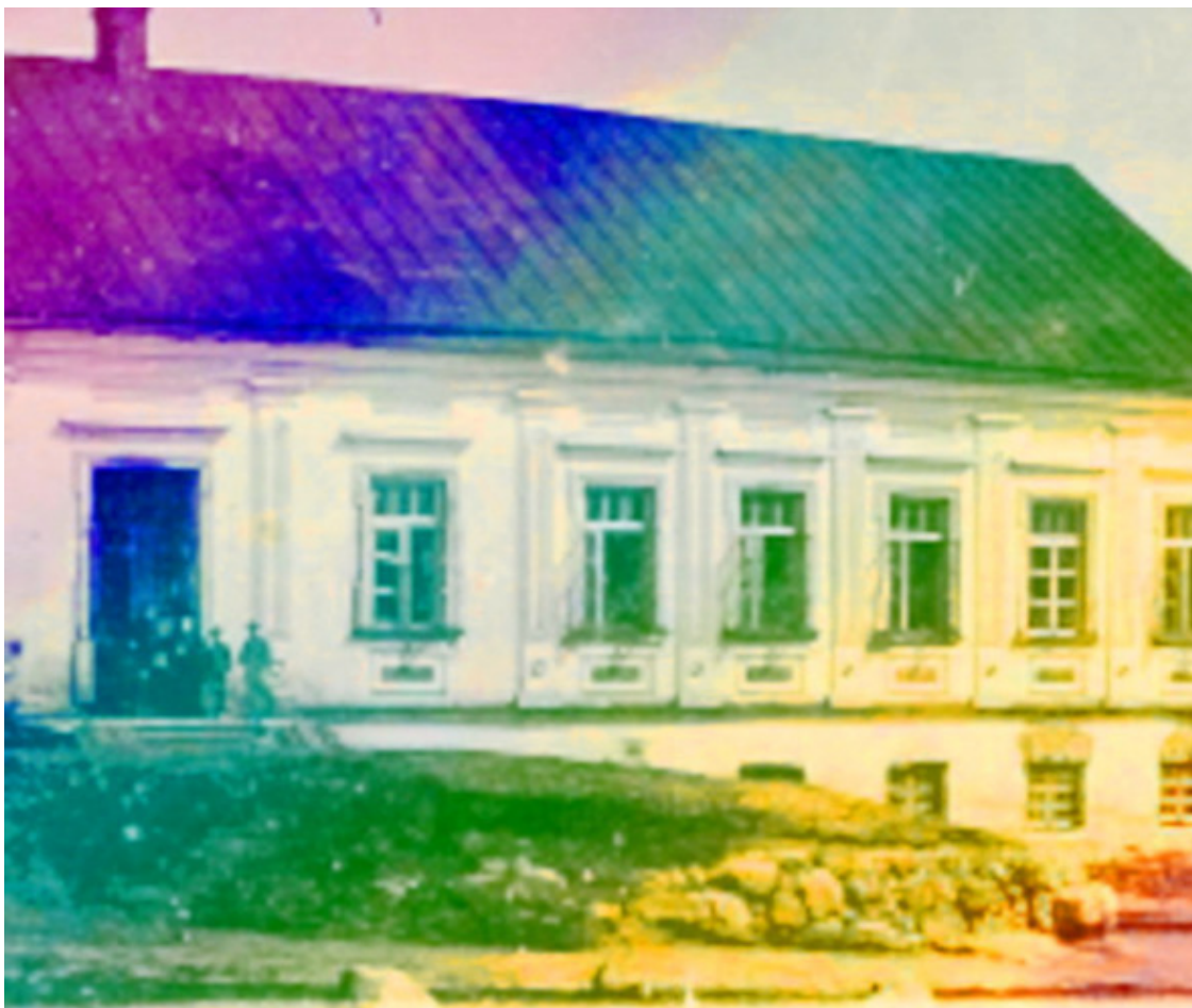
Воложинская иешива в прошлом

«Он воспользовался этой возможностью, чтобы получить официальное признание йешивы, предъявив в министерстве образования защитное письмо, выданное в своё время его отцу».