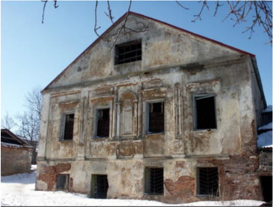
Иешива в Воложине.

Возникновение в Воложине иешивы обязано великому Виленскому Гаону (Элияху бен Шломо Залману) несмотря на ее функционирование уже после ухода Гаона из жизни. Заниматься преподаванием в Воложинской иешиве Гаон поручил лучшему своему ученику – Хаиму Воложинскому (являвшемуся уроженцем этих мест).