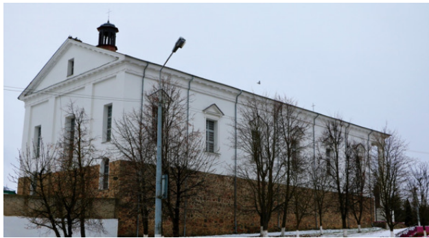
Воложинская иешива в несколько обновленном виде.