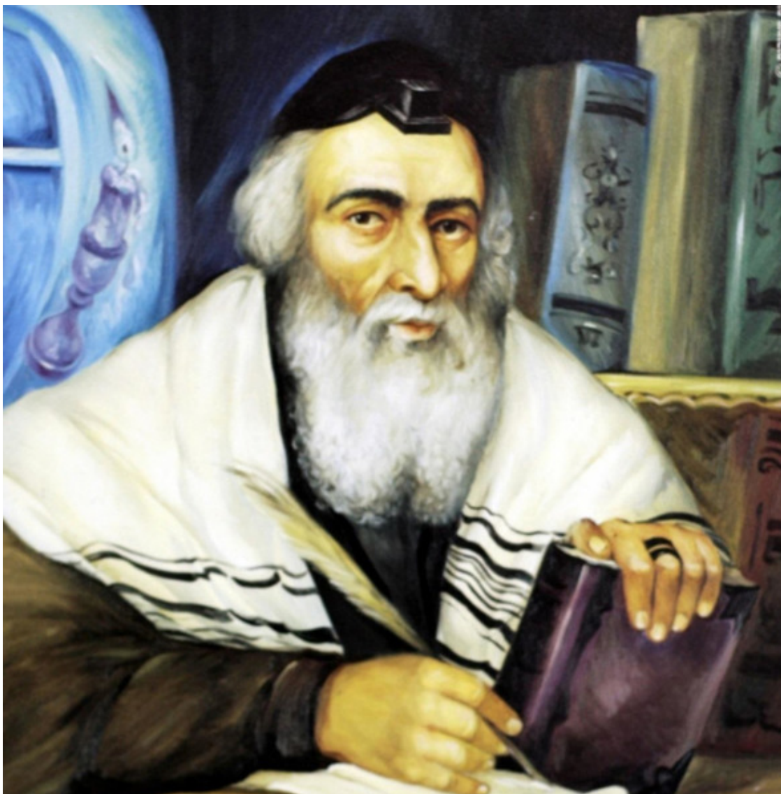
Элияху Бен Шломо Залман. Виленский Гаон.

«В это время в Вильно уже существовали две йешивы, однако раввин Хаим решил основать новую – возможно, чтобы выйти из-под влияния виленской общинной администрации, страдавшей внутренними раздорами, и самое главное, чтобы организовать изучение Талмуда в соответствии со своими собственными взглядами. Он противился традиционно устоявшемуся правилу проживания учеников йешив в семьях, за пределами йешивы. Не хотел допустить попадания учащихся под влияние внешней среды. Для этого он взял на себя обеспечение учеников средствами к существованию. Для сбора средств на йешиву он обратился к еврейским общинам. В результате Воложинская йешива стала не просто местным учебным заведением, а предприятием всей литовской общины (миснагдим) и прототипом всех литовских йешив, основанных после этого».