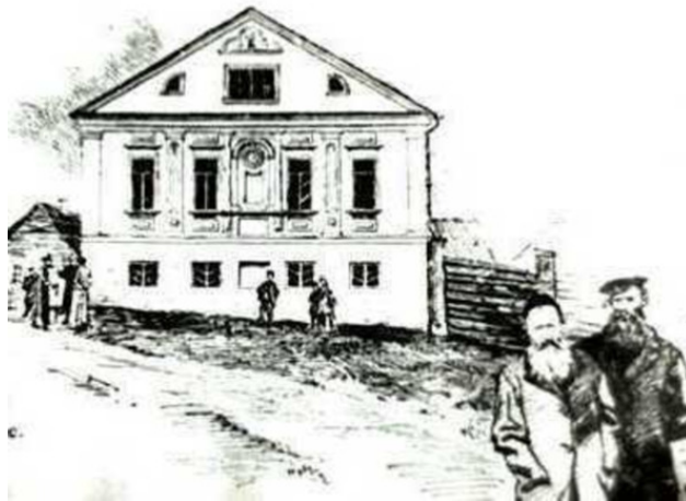
Воложинская иешива на старинной открытке

«Не толькі з усёй Расеі ды Еўропы, але і з усяго свету – з Амерыкі, нават Японіі прыязджаюць сюды вучыцца на рабінаў. (...) і жыды тутэйшыя (...) не трайкочуць яны, як тыя сарокі, чужой мовай; не, яны моцна трымаюцца сваёй веры, звычайу, мовы...».