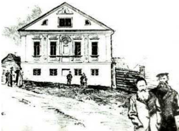
Воложинская иешива на старинной открытке

«Не толькі з усёй Расеі ды Еўропы, але і з усяго свету – з Амерыкі, нават Японіі прыязджаюць сюды вучыцца на рабінаў. (...) і жыды тутэйшыя (...) не трайкочуць яны, як тыя сарокі, чужой мовай; не, яны моцна трымаюцца сваёй веры, звычайяў, мовы...».