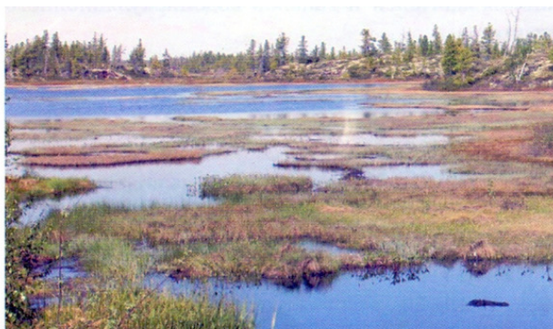
Рис. 2. Западная Сибирь. Район будущей добычи нефти и газа

Были и сомнения в возможности использования земснарядов, так как район добычи расположен в зоне вечной мерзлоты у Северного Полярного круга и выше, включая полуостров Ямал. Летний сезон с положительной температурой для работы земснарядов мог составлять не более 4—5 мес. Район необжитый, с полным отсутствием жилищной инфраструктуры.